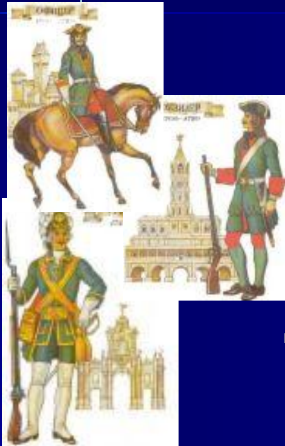
Солдаты Петра I