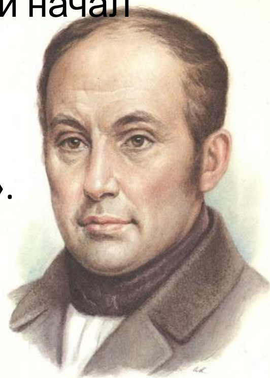
Василий Андреевич Жуковский 1783—1852