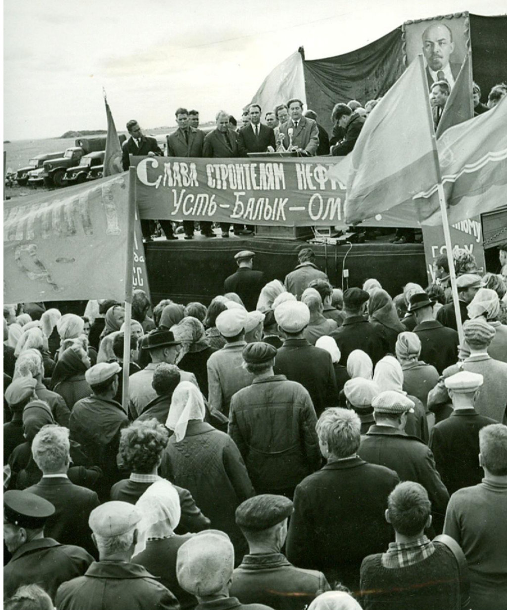
Участники митинга в честь окончания основных линейных работ на трассе нефтепровода Усть-Балык – Омск

Автор: Сапожков И. И. 27.07.1967, ХМАО ГБУТО ГАСПИТО ФФ. Оп.1, т.2. Д.1412.