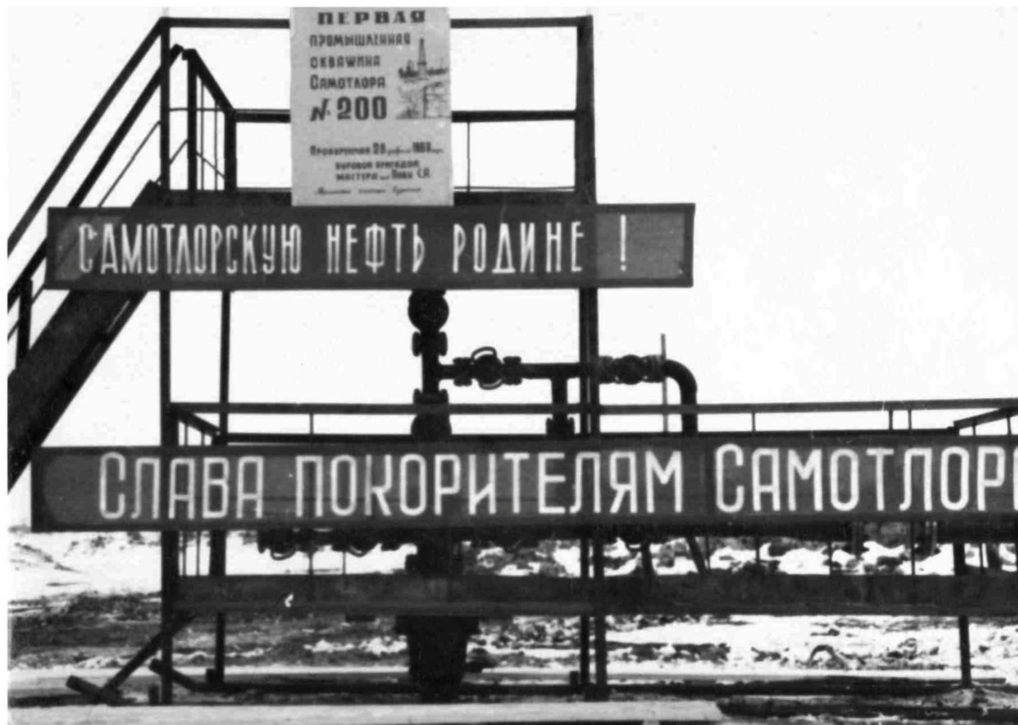
Первая эксплуатационная скважина Самотлора

Автор: Г. П. Крыжановский. 02.04.1969, г. Нижневартовск.