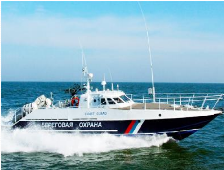
Пограничный морской катер на дежурстве