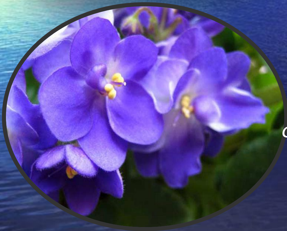
Фиалка - символ штата