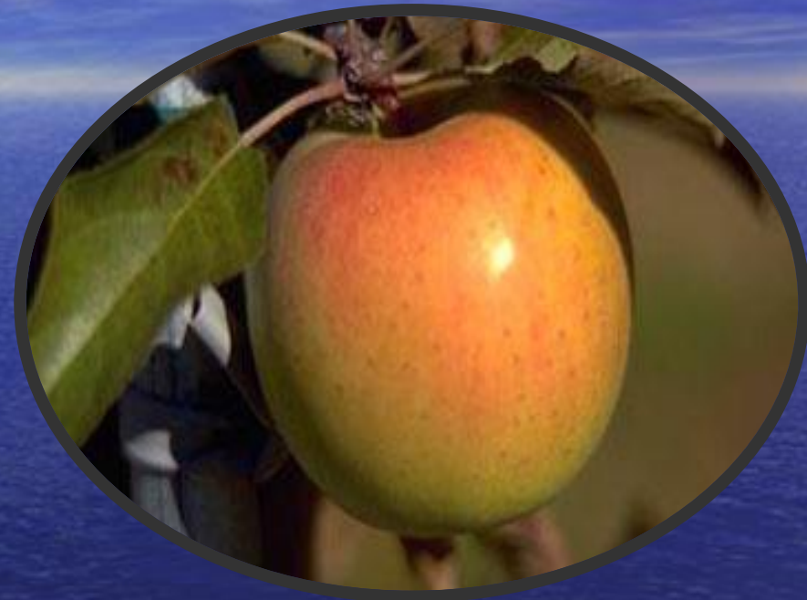
Яблоки сорта Gold Rush