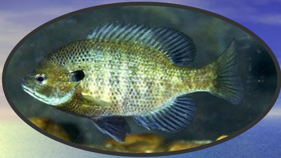
Солнечный окунь – символ штата Иллинойс