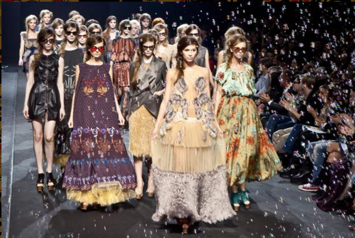
Алена Ахмадуллина. Весна- лето 2015

Смотреть коллекции Алены Ахмадуллиной — это всегда сплошное удовольствие. А новые, весенние образы, это вообще что-то волшебное, сказочное и необыкновенное.