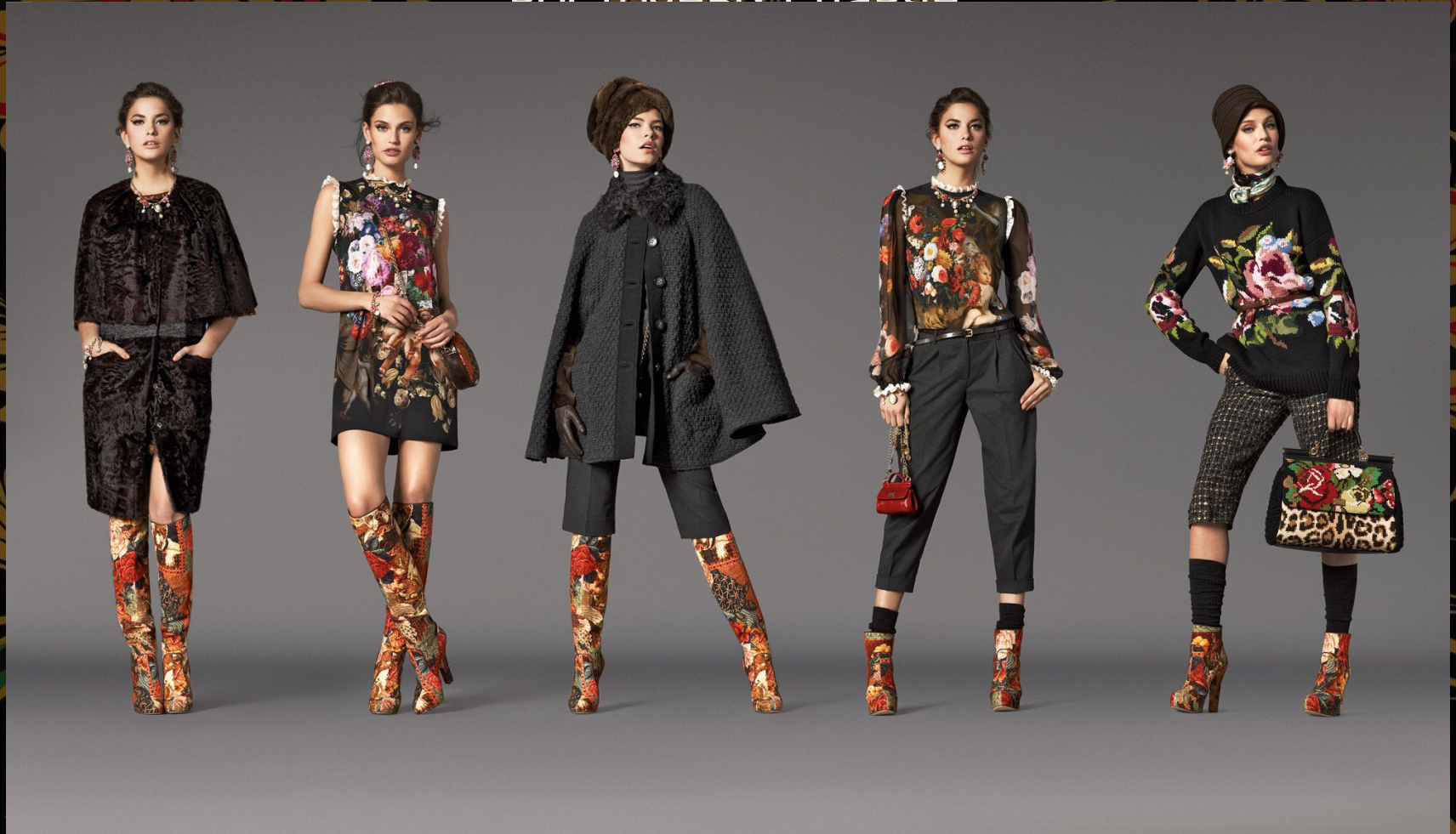
Dolce & Gabbana. Осень-зима 2012-2013

Эта коллекция стала одной из знаковых в модной индустрии. Источником вдохновения для дизайнеров стала культура восточных славян