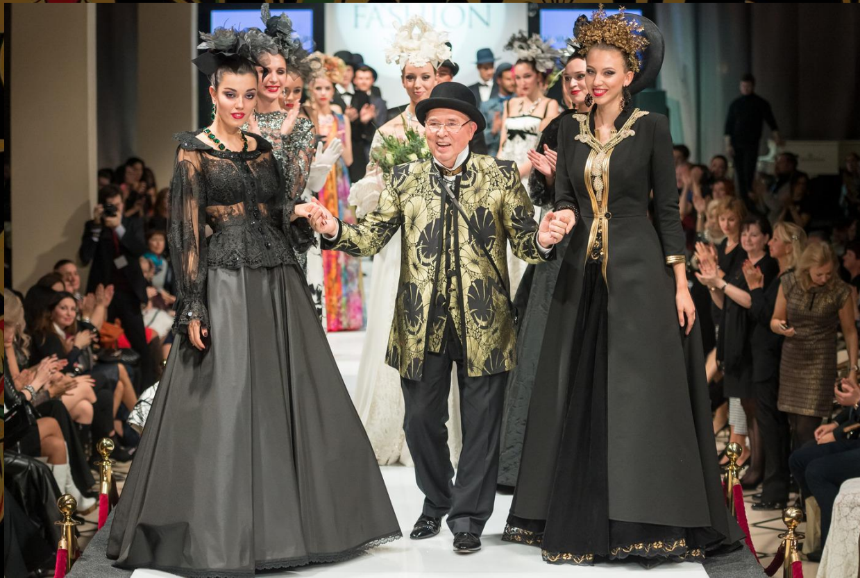
Вячеслав Зайцев. «Ноктюрн». 2016.

Вячеслав Зайцев, пожалуй, самый заслуженный современный деятель в области русского стиля. Его вклад в русскую моду трудно переоценить. Все его коллекции пронизаны мотивами русского народного костюма, вдохновлены русской действительностью.