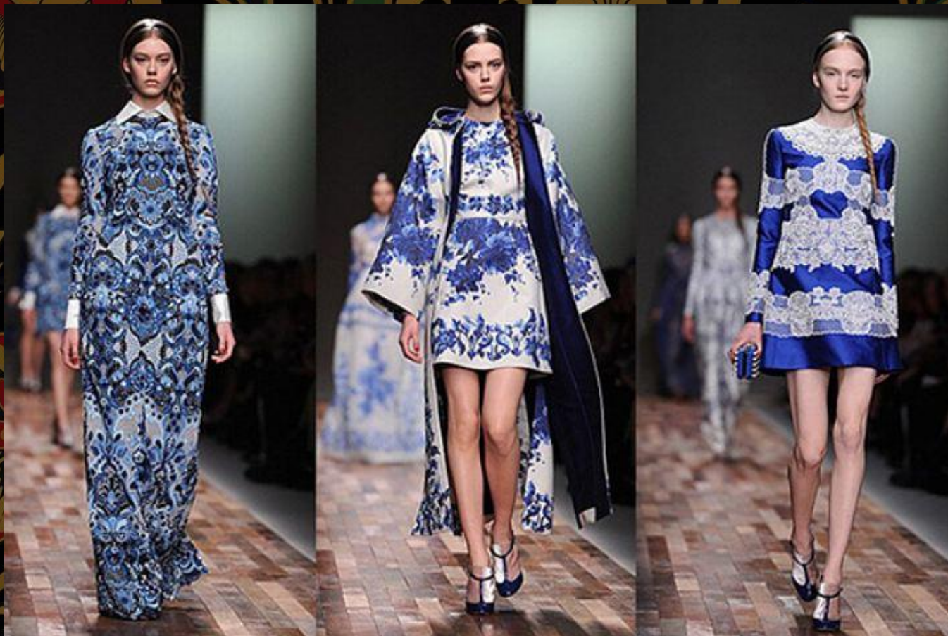
Valentino. Осень-зима 2013-2014

Очень легкую, женственную коллекцию создает модный дом Valentino. Источником вдохновения автора послужил народный промысел гжель. Несмотря на то, что традиционное использование этого мотива ограничивается предметами быта, дизайнер находит ему новое современное прочтение.