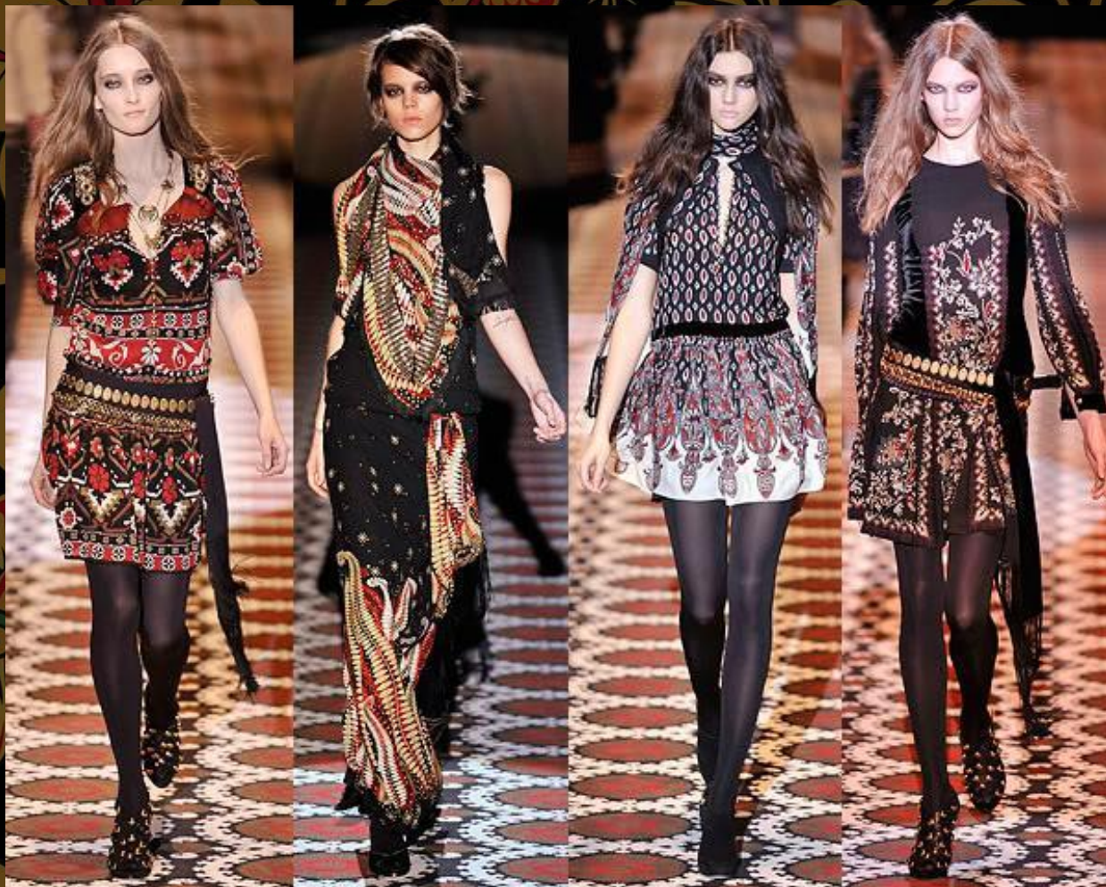
Yves Saint Laurent. Весна- лето 2014

Одежда в русском стиле – это уникальное сочетание современных трендов и русских национальных мотивов, воплощенное в максимально удобных для повседневной носки вещах.