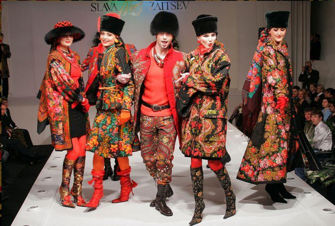
Вячеслав Зайцев. Осень-зима 2013

Современный русский стиль в одежде - это куртки, джинсы, толстовки, трикотажные топы, блузы, сарафаны, платья, головные уборы и иные элементы гардероба, украшенные исконно русскими мотивами, которые великолепно вписываются практически в любой образ.