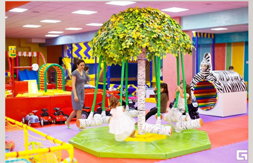
Детская игровая зона