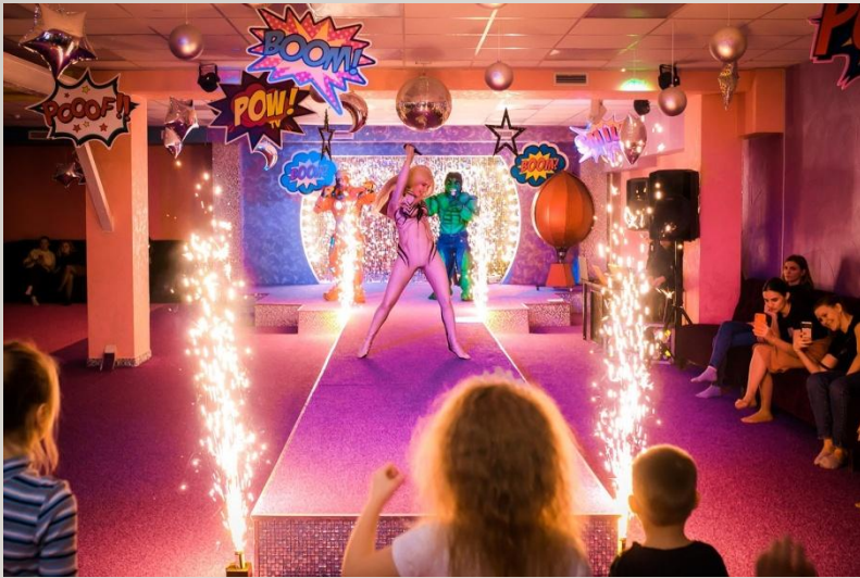
Шоу «Comics Party»