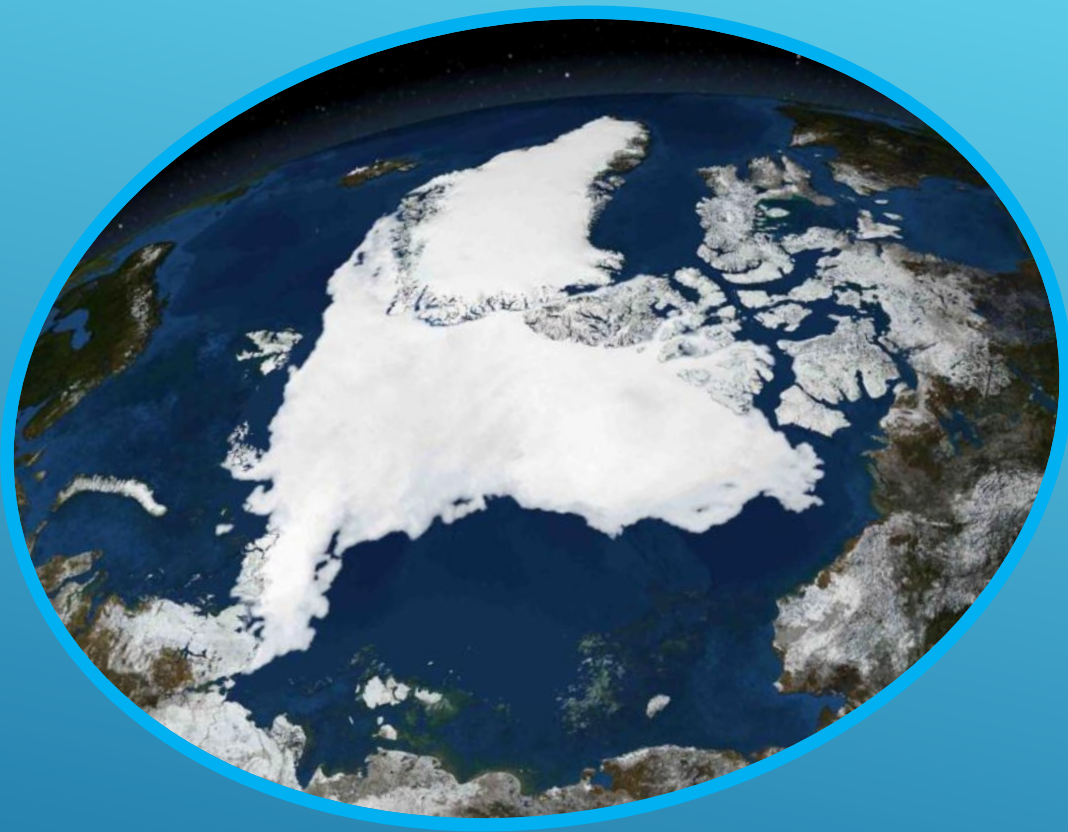
Арктика. Северный полюс