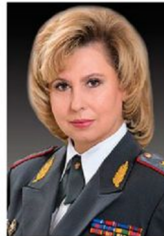
Татьяна Николаевна Москалькова – уполномоченный по правам человека в России с 2016 г.

Инициатором Единого урока права выступил Уполномоченный по правам человека в Российской Федерации Т.Н. Москалькова при поддержке уполномоченных по правам человека в 85 субъектах Российской Федерации, Минобрнауки России и Временной комиссии Совета Федерации по развитию информационного общества.