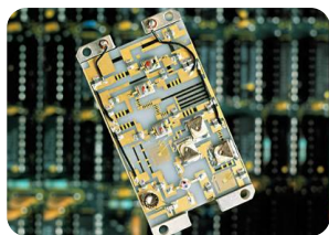
Микро- электронное производство