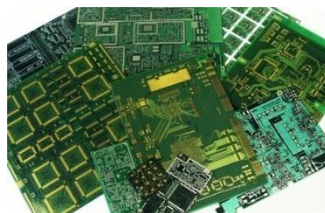
Изготовление печатных плат