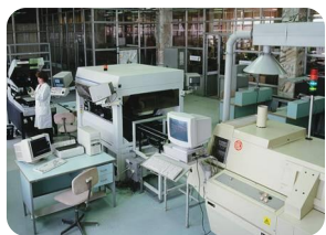
Монтаж компонентов и сборка электронных устройств