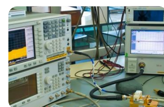
Испытательный центр ЭРИ