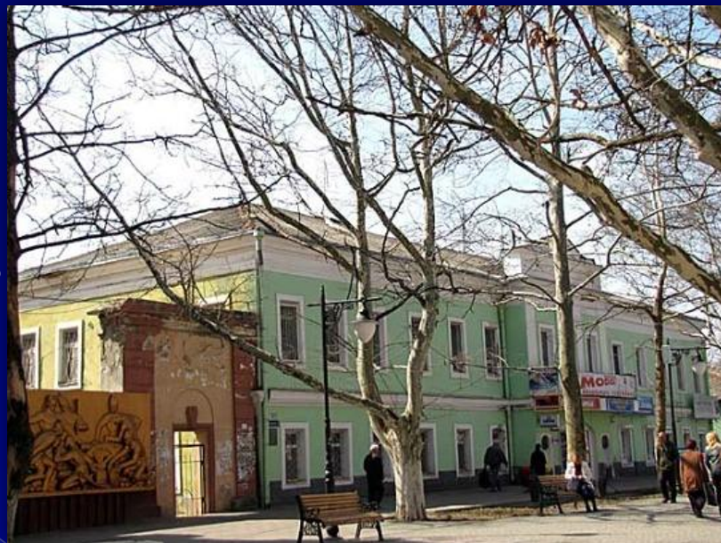
Расположен на улице Суворова.

Планировалось сделать в здании музей, посвященный Суворову, Черноморскому казачьему войску, но эта идея не была реализована. Зато улица носит имя Суворова.