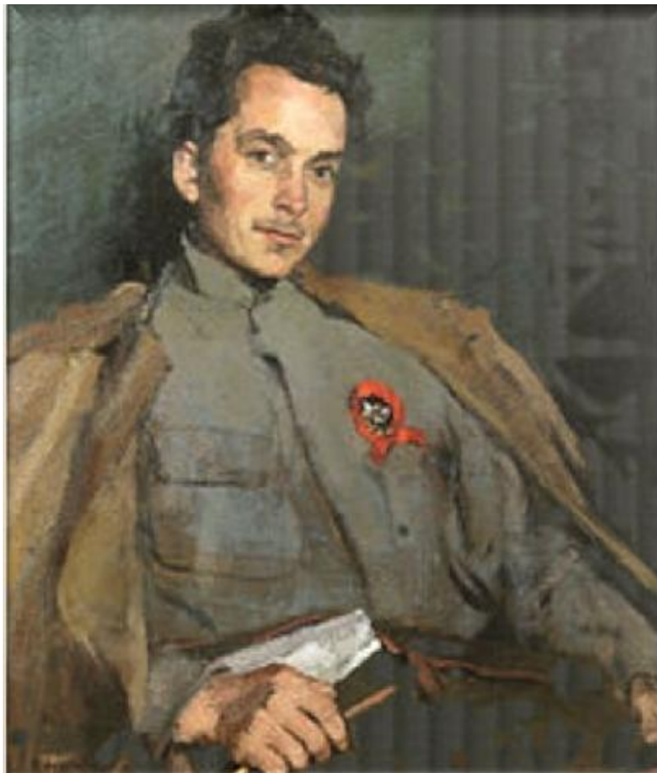
Художник Сергей Малютин