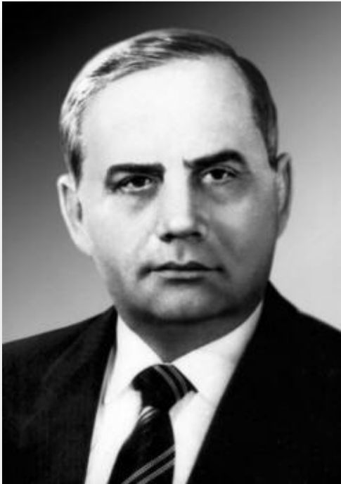
Володимир Івашко Голова ВР УРСР 12-го скликання