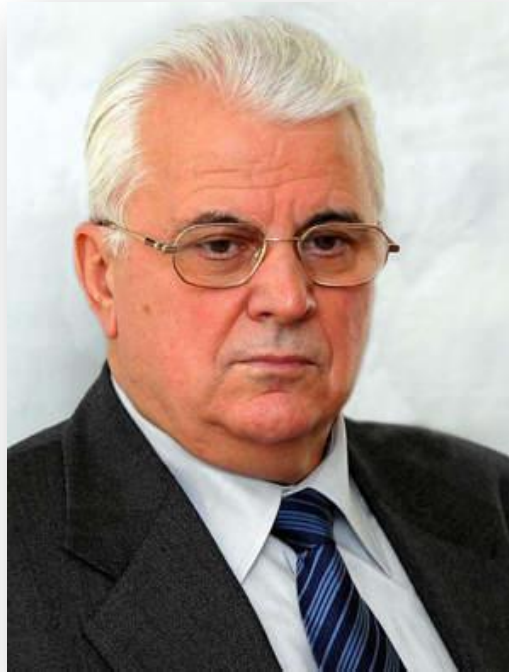
Леонід Кравчук Голова ВР з липня 1991 року