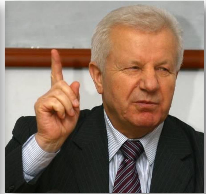
Олександр Мороз керівник депутатської більшості "За Радянську суверенну Україну"