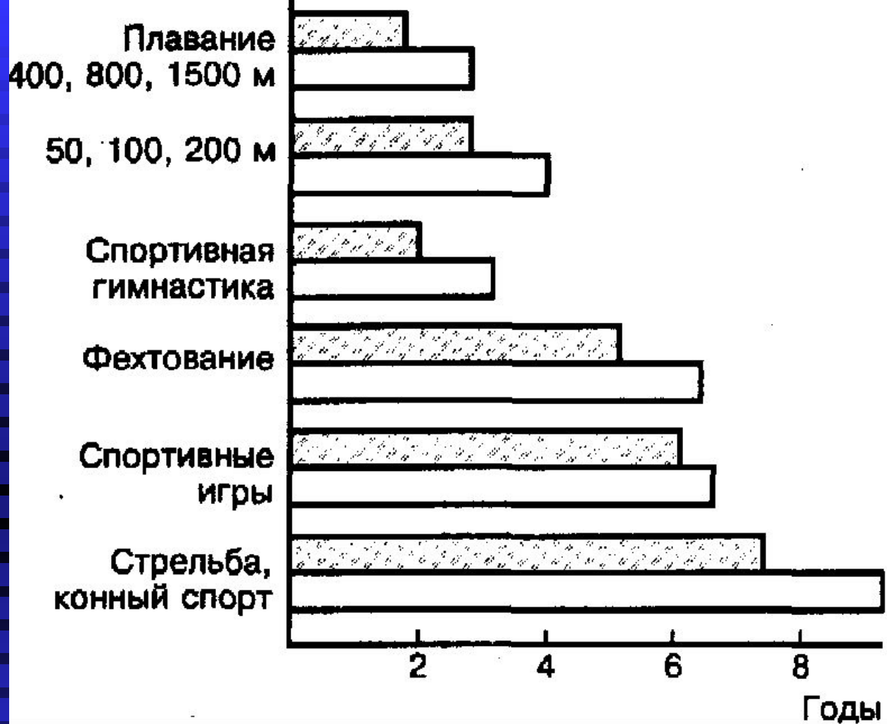
Рис. Продолжительность сохранения показателей долговременной адаптации, обеспечивающих выступление на уровне высших достижений в различных видах спорта у женщин (заштриховано) и мужчин