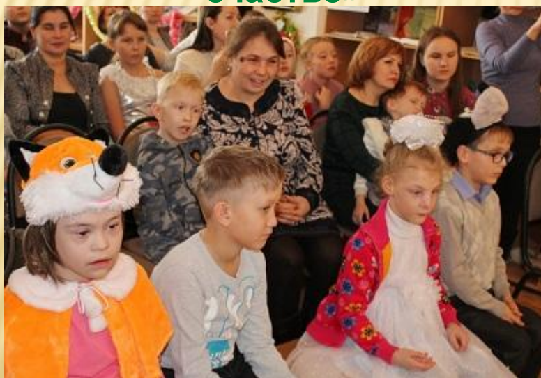
«Новый год в Дукеморе»