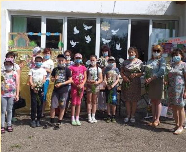
Семейный праздник «Ромашковое счастье»