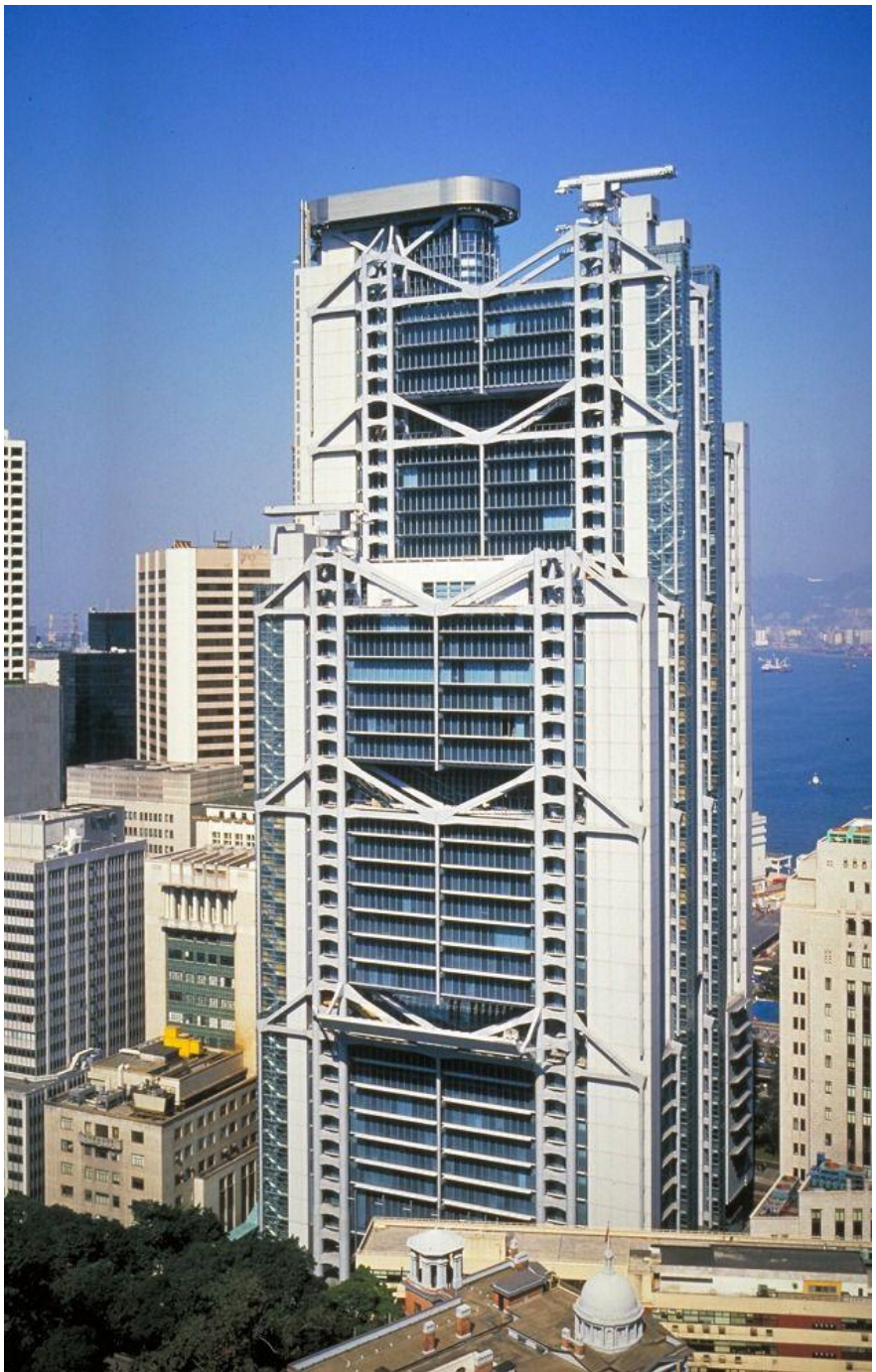
Здание Банка Гонконга и Шанхая (HSBC) архитектор Норман Фостер 1985 год