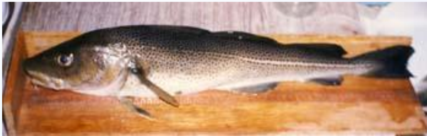
Кильдинская треска. 1997 г