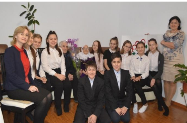
Гыйльмури әби малае белән