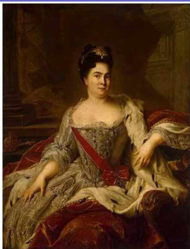
«Портрет Екатерины I (1684–1727)» Жан-Марк Натье, 1717 г.