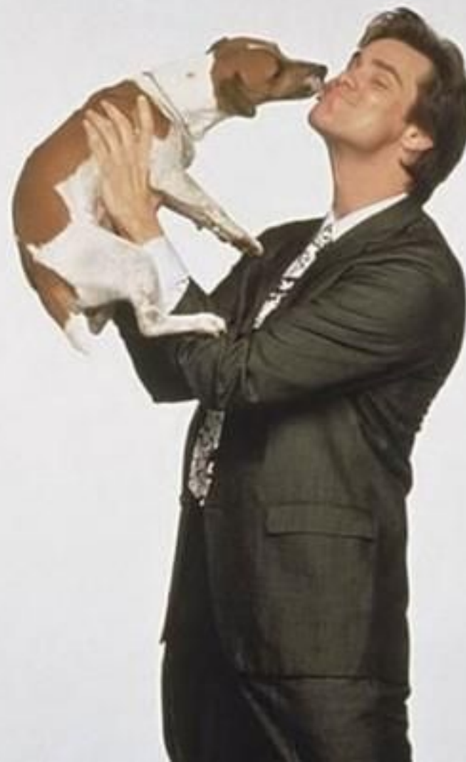
◆ Джим Керри с Майло

Очаровательная сцена в фильме, как пес бросается искать ключи для своего хозяина по первому его требованию, а когда находит - не отдает, потому что хочет играть, очень отражает суть характера этих собак. Такие питомцы нуждаются не только в том, чтобы служить своему владельцу, но и в том, чтобы получать от него похвалу в виде активной спортивной игры. Забавно и то, во что превратился пес, когда надел волшебную маску. Любой хозяин такой собаки согласится, что это и есть его истинная «морда» - хулиганистый, но не злобный, все время посмеивающийся над собственными проделками, очаровательный пес.