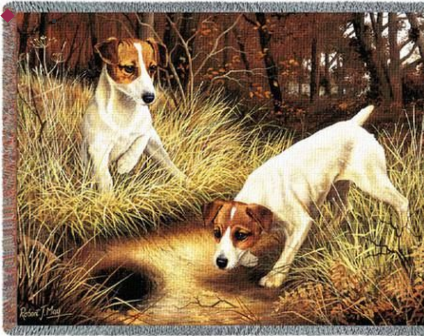
◆ Преподобный Джек Рассел