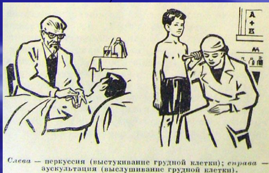
Слева — перкуссия (выстукивание грудной клетки); справа — аускультация (выслушивание грудной клетки).