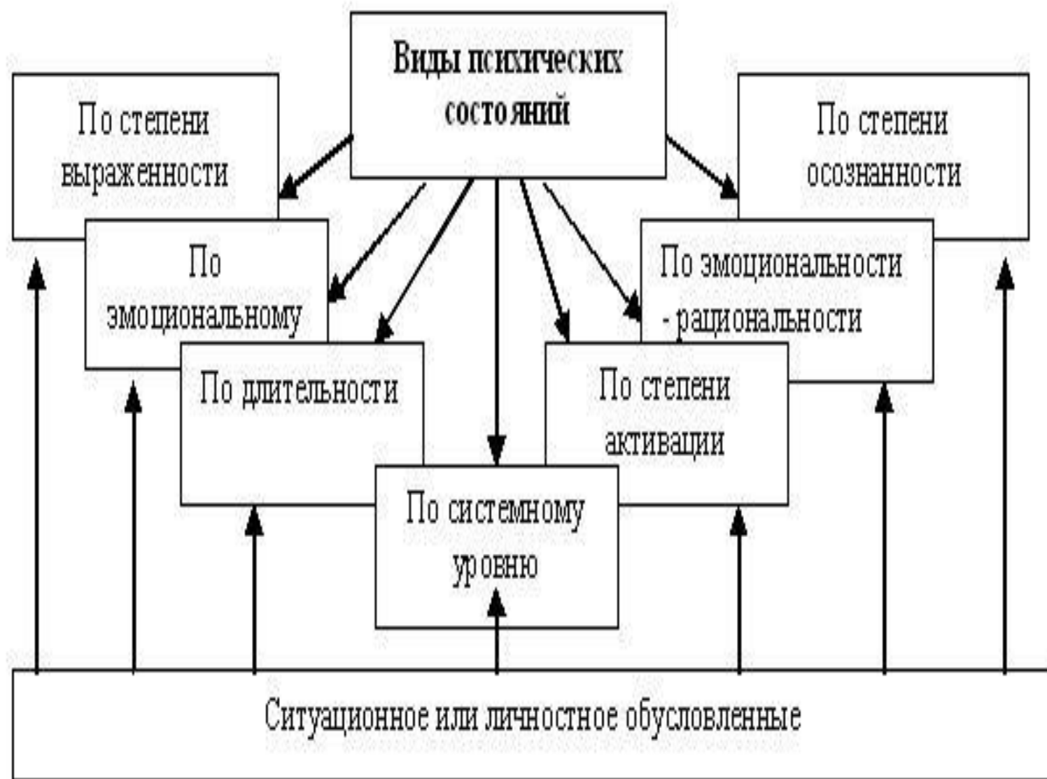
Рис. 14.1 Виды психических состояний