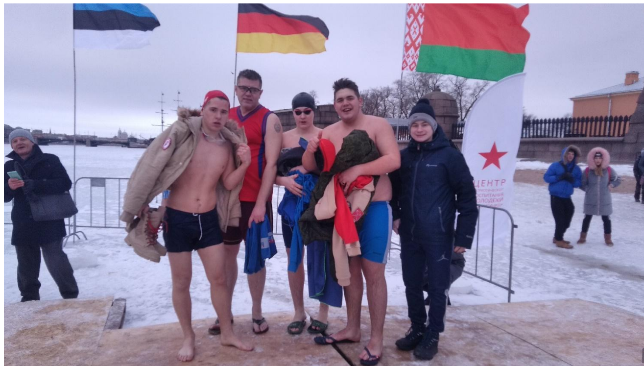
«Кубок Большой Невы» I место