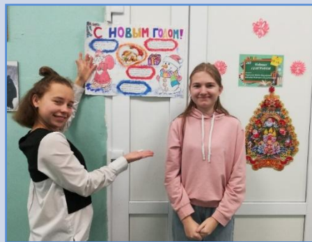
У классной двери.