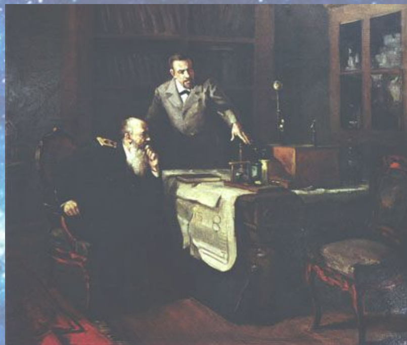
А. С. Попов демонстрирует действие своего прибора