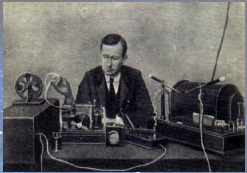
Г.Маркони у своей приёмопередающей станции

Продолжая опыты и совершенствуя приборы, А. С. Попов медленно, но уверенно увеличивал дальность действия радиосвязи. Через 5 лет после постройки первого приемника начала действовать регулярная линия беспроволочной связи на расстоянии 40 км. благодаря радиограмме, переданной по этой линии зимой 1900г. , ледокол “Ермак” снял со льдины рыбаков, которых шторм унес в море . Радио, начавшее свою практическую историю спасением людей, стало новым прогрессивным видом связи XX в.