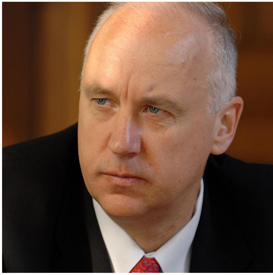
Председатель Александр Иванович Бастрыкин