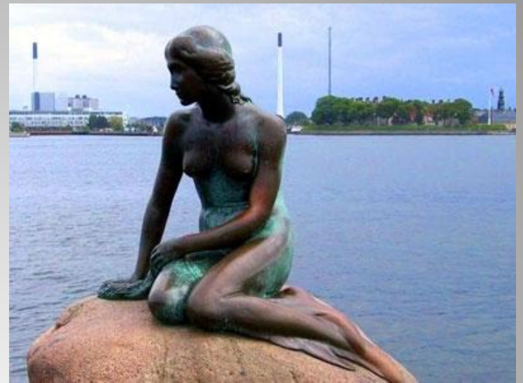
Русалочка в Дании