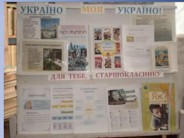
- виставка- полеміка