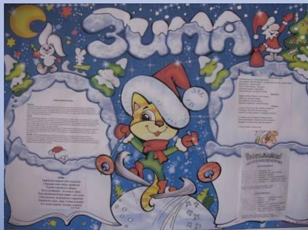
- виставка- календар