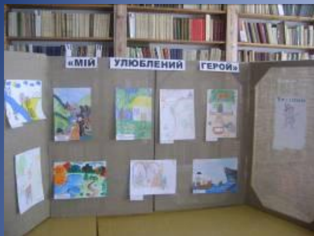
Виставка книжкових ілюстрацій