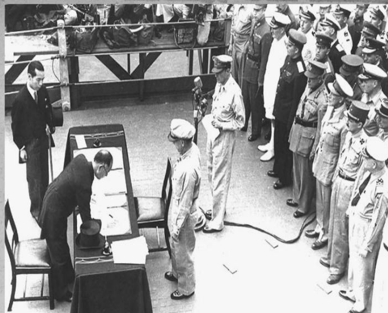
Капитуляция Японии, 2 сентября 1945 г.