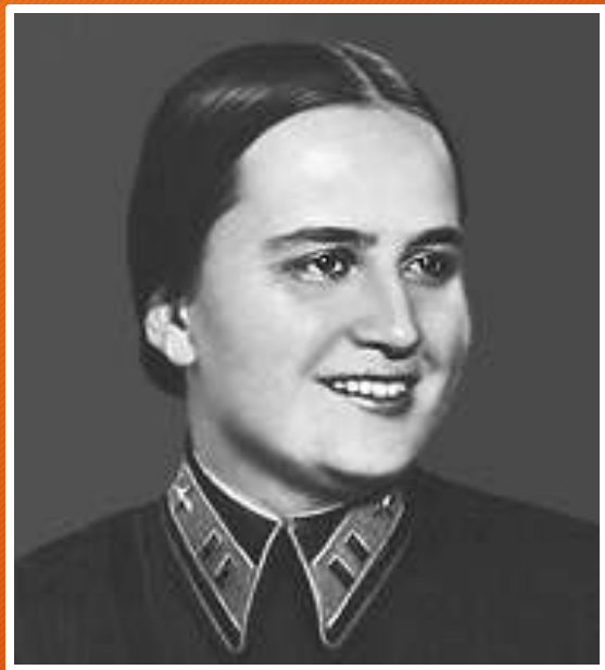
М. М. Раскова