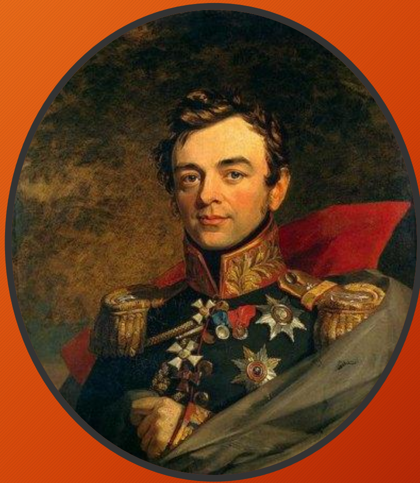
граф, генерал-фельдмаршал И. Ф. Паскевич-Эриванский князь Варшавский