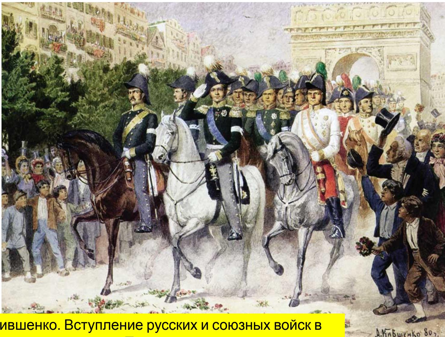
А. Кившенко. Вступление русских и союзных войск в Париж.

В 1814 году русские войска и их союзники вошли в Париж. Так закончилась попытка поставить Россию на колени.