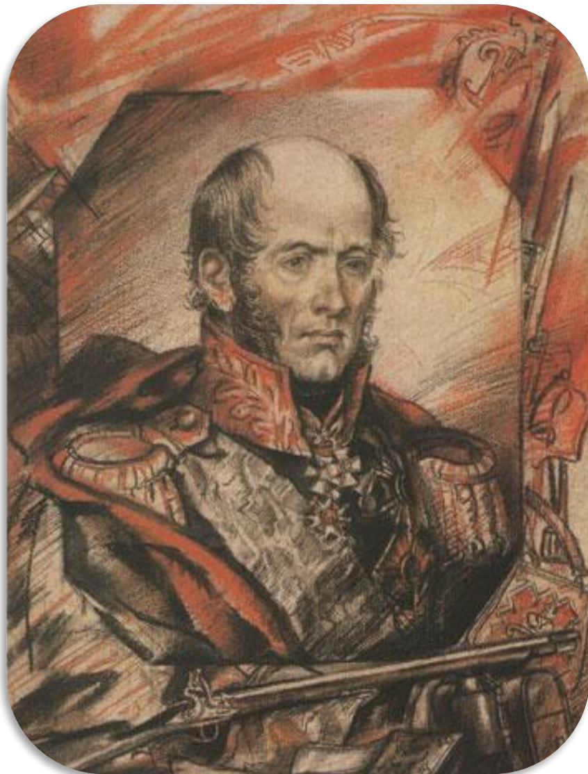
Михаил Богданович Барклай де Толли