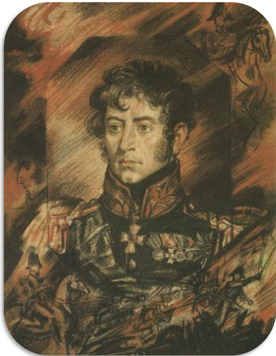
Михаил Андреевич Милорадович