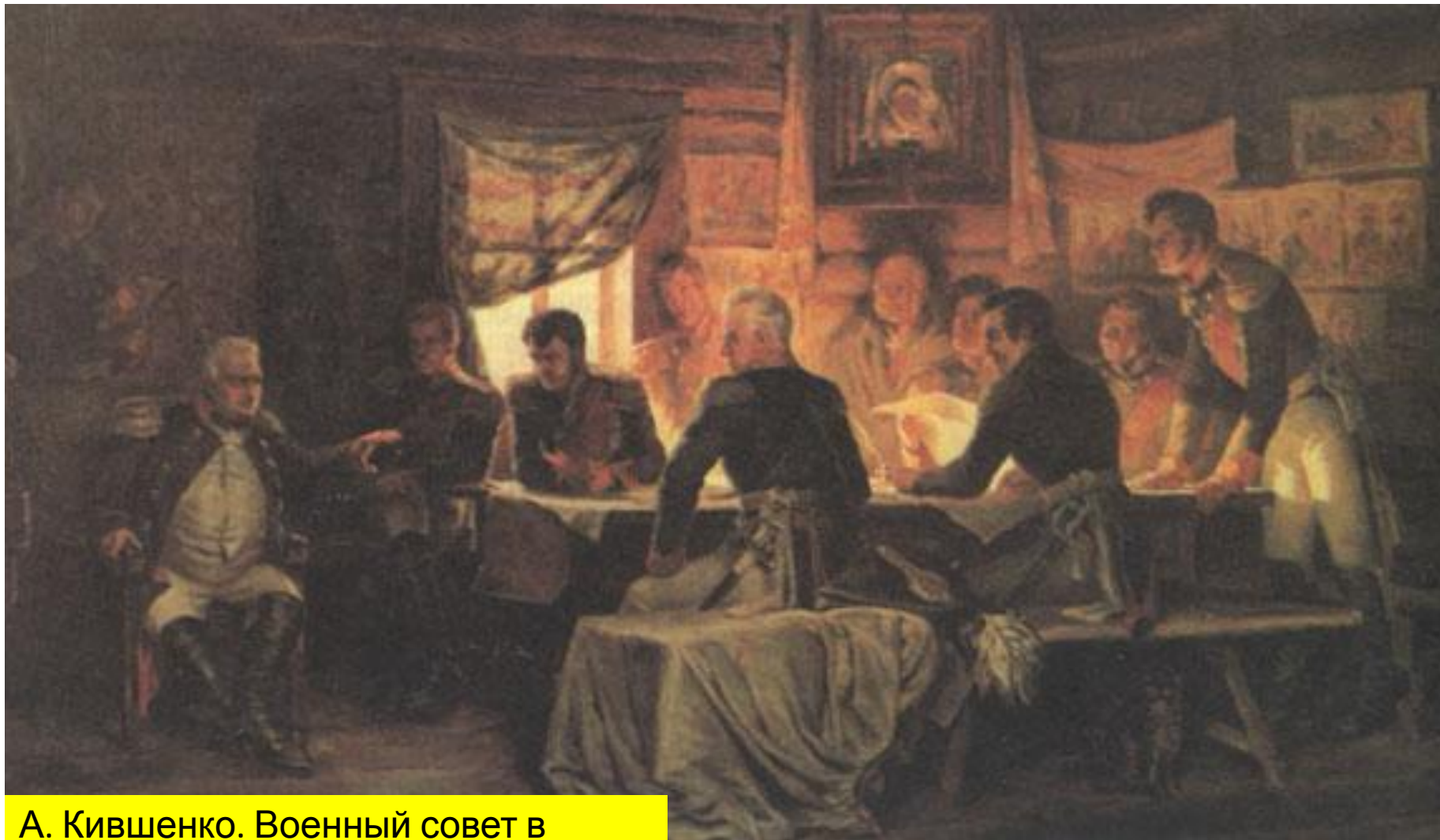
А. Кившенко. Военный совет в