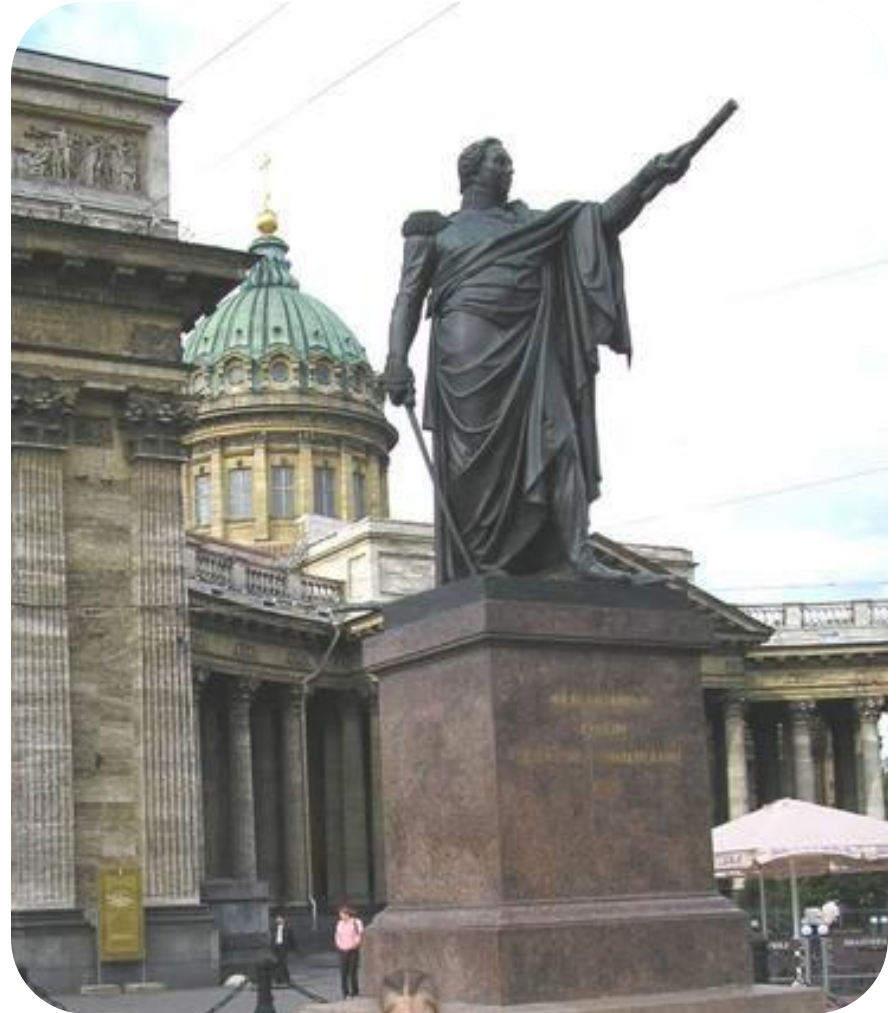
Памятник Кутузову около Казанского собора.