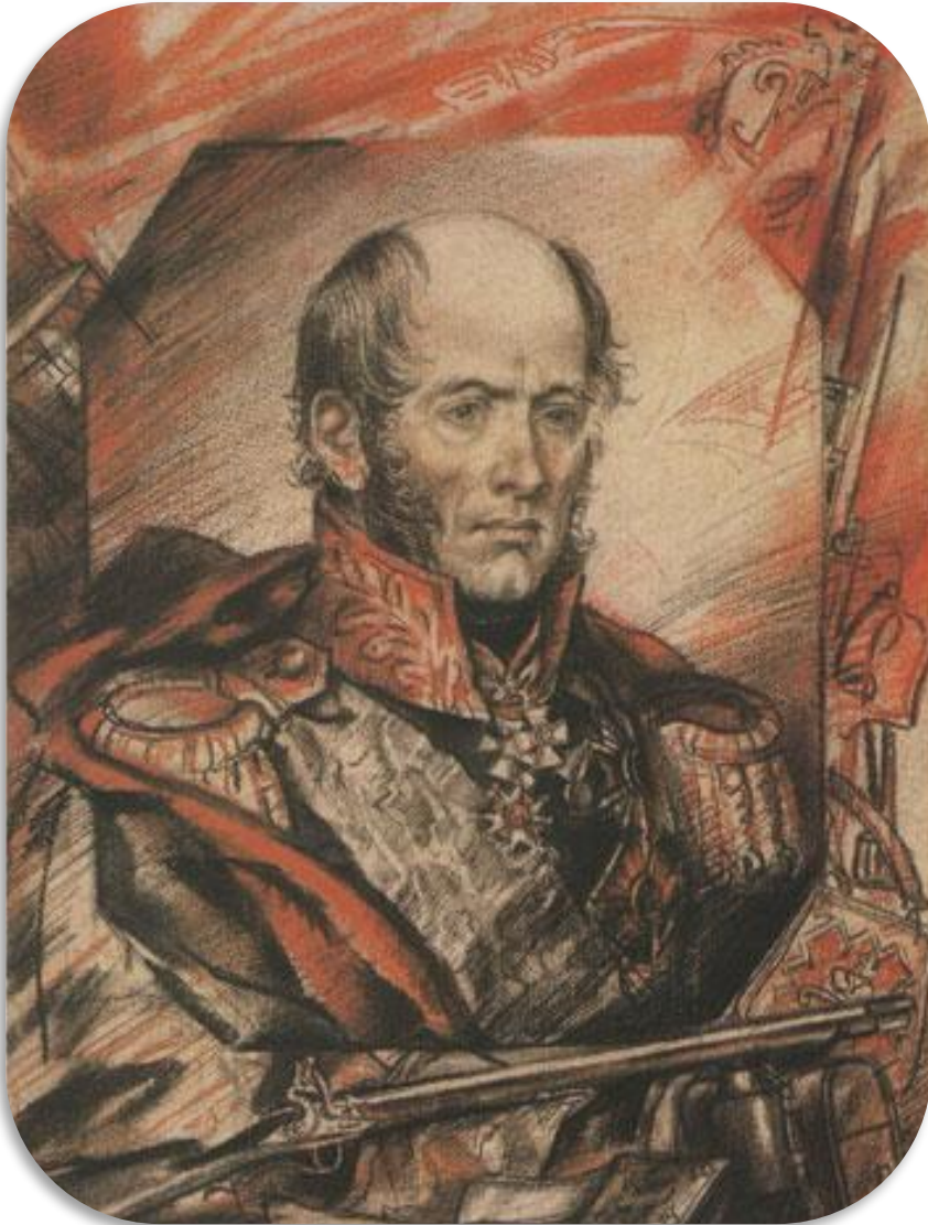
Михаил Богданович Барклай де Толли