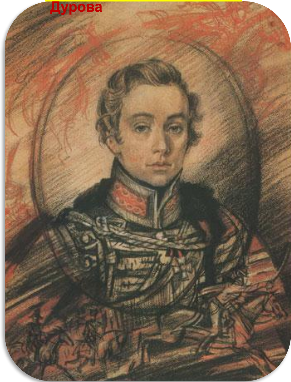
Надежда Андреевна Дурова