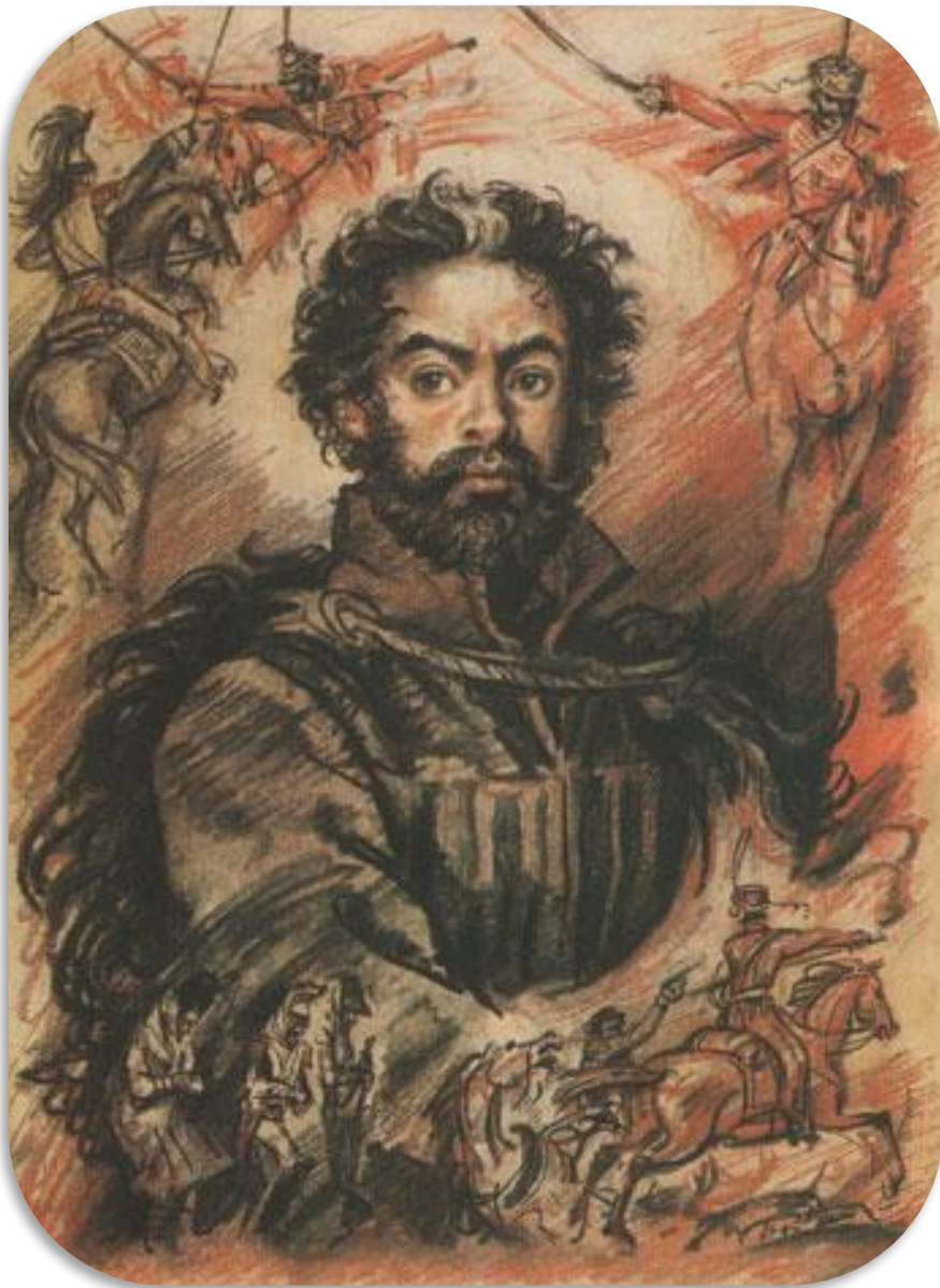
Денис Васильевич Давыдов