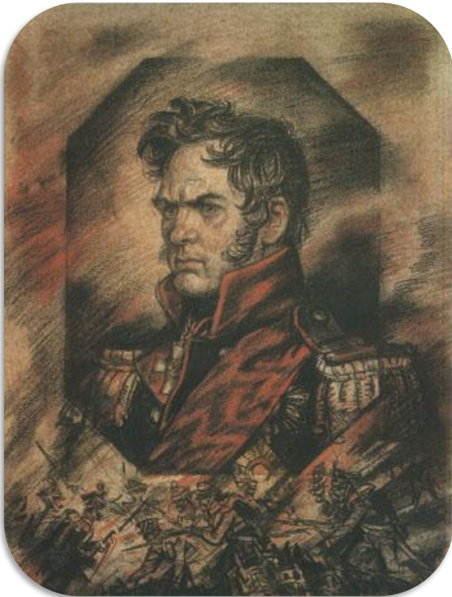
Алексей Петрович Ермолов