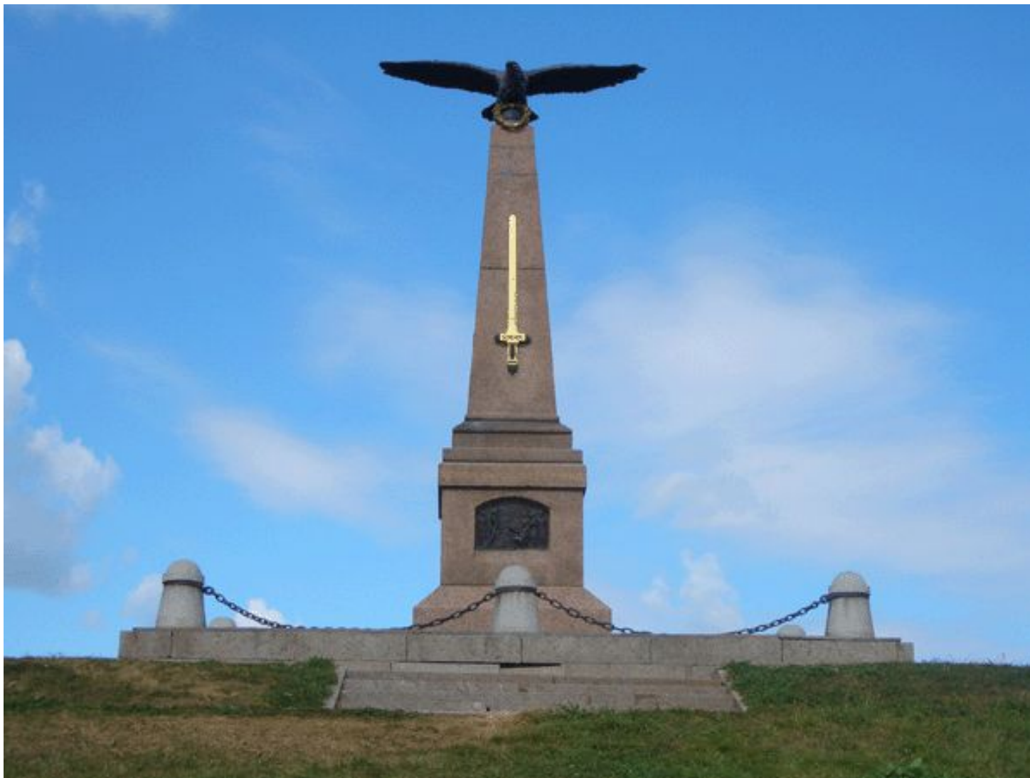
Памятник русским воинам на Бородинском поле.