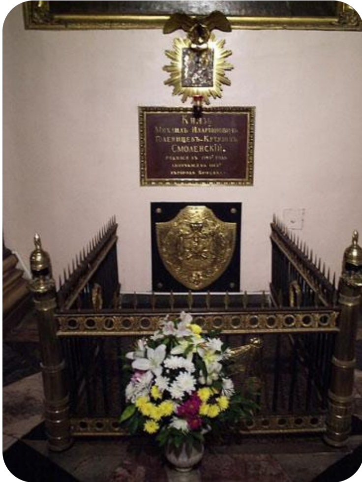
Могила М. И. Кутузова в Казанском соборе.