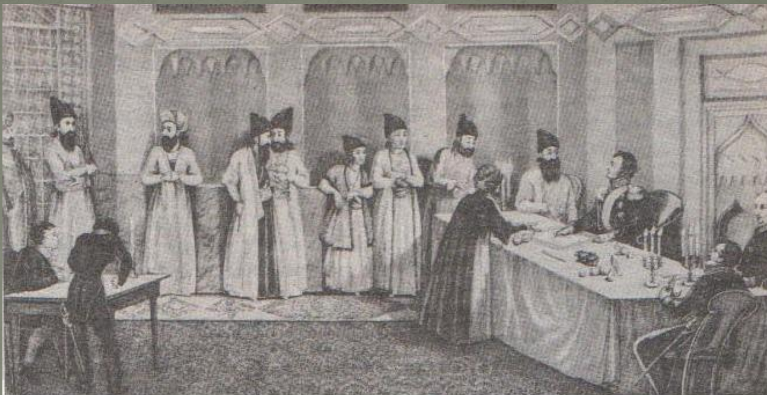
Заклучение Туркманчанского договора после войны между Россией и Турцией 1828-1829гг. (Справа, у торца стола, сидит Грибоедов)

Грибоедов назначен полномочным министром в Тегеран. Это была «политическая ссылка».