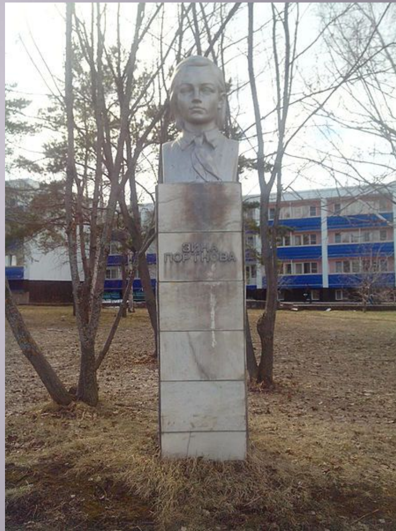
Памятник Зинаиде Портновой - Бывший пионерский лагерь "Алые Паруса" село Ягодное, близ города Тольятти, Россия.