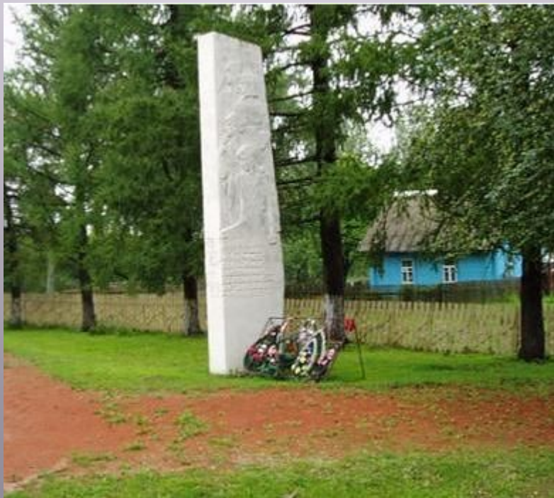
Обелиск в поселке Оболь.