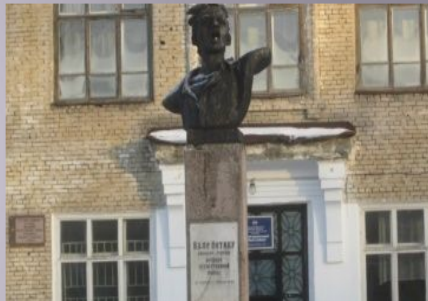
Памятник Вале Котику в город Бор Нижегородской обл.

Медаль «Партизану отечественной войны II степени».