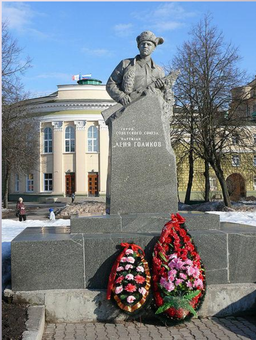
Памятник Лене Голикову в Великом Новгороде