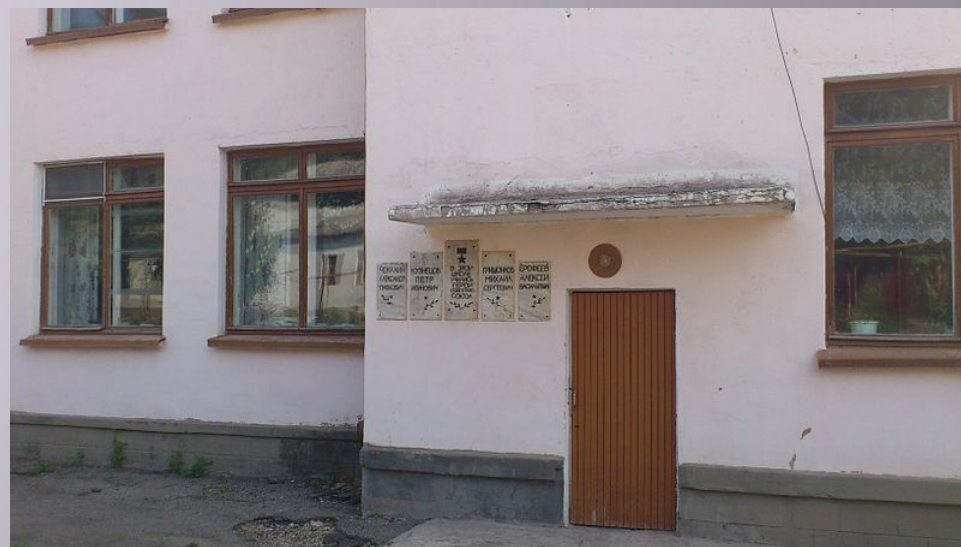
Мемориальная табличка на средней школе с именем Александра Чекалина.