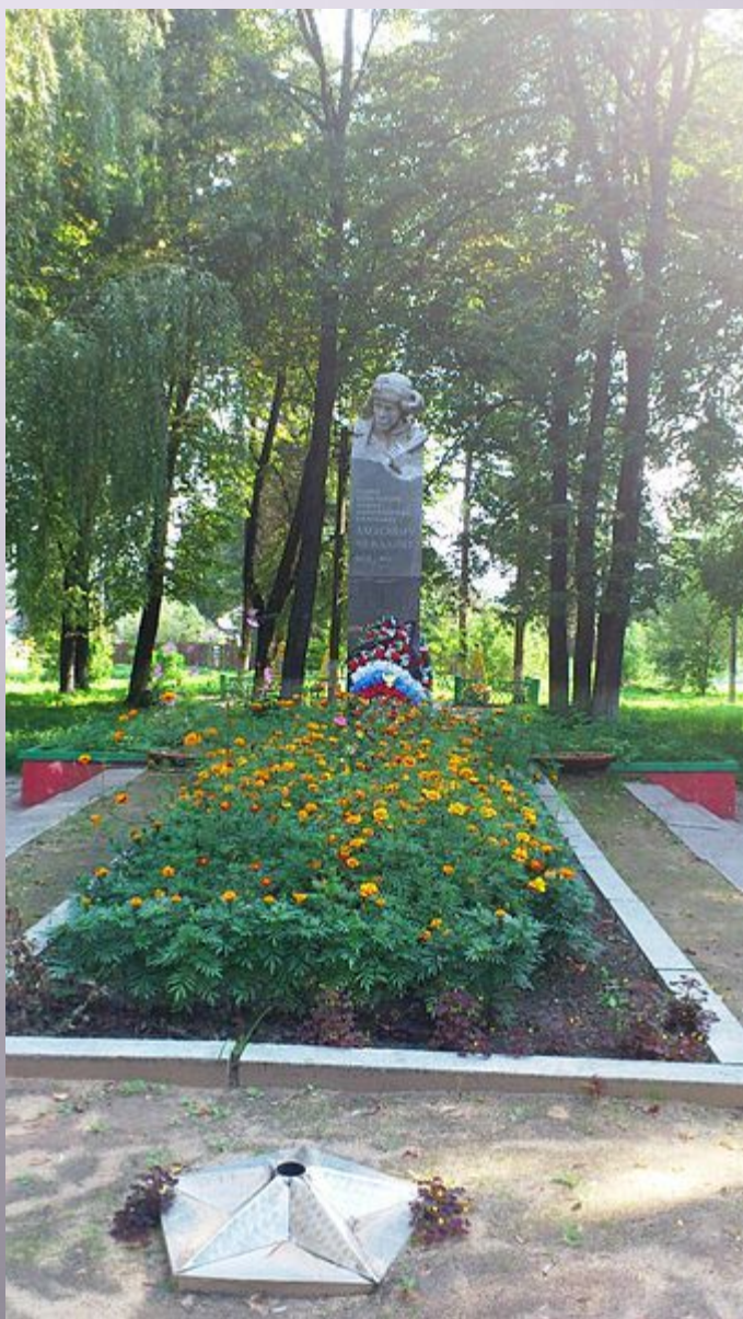
Памятник в городе Чекалине.