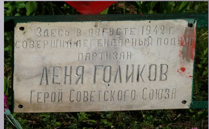
Мемориальная надпись на месте подвига Лени в селе Острая лука Псковской области