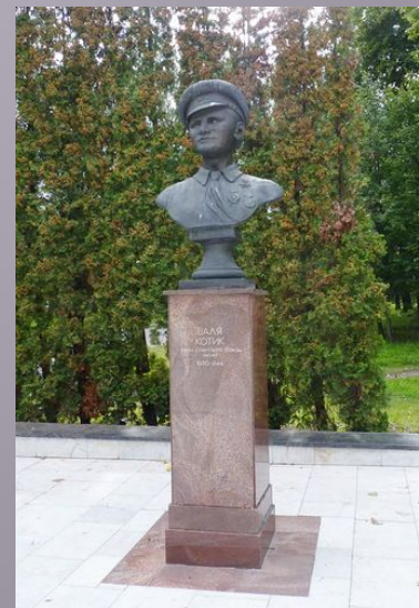
Памятник Пионеру-Герою Вале Котику в Москве.