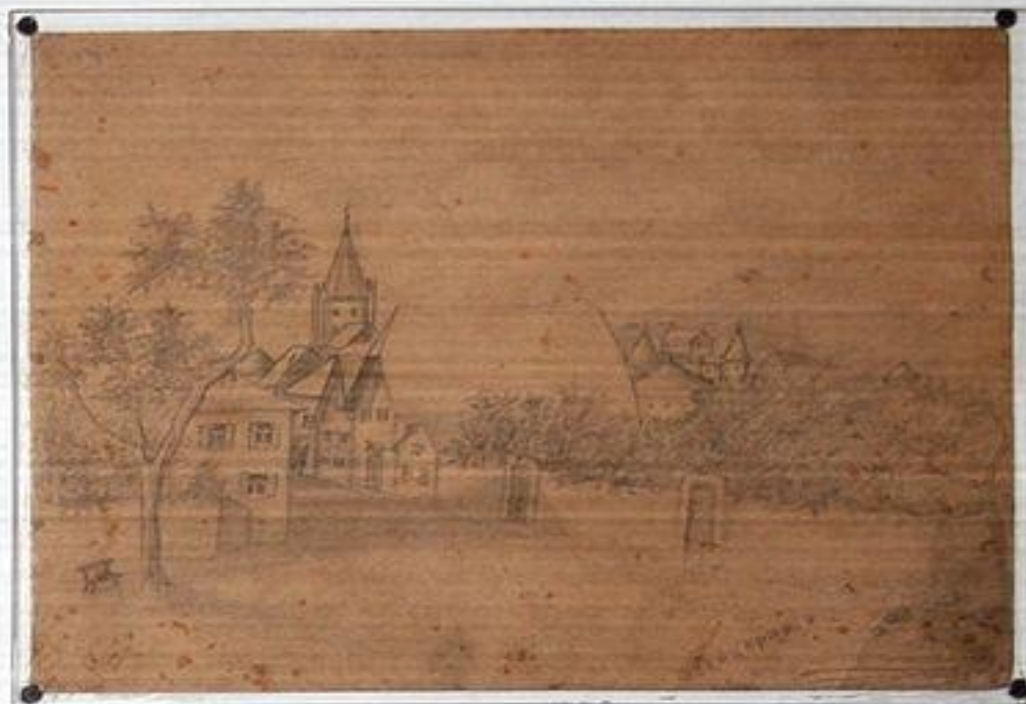
Рисунки бити Коробкова.