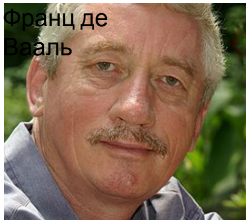
Франц де Вааль

«Мы — млекопитающие, то есть животные, отмеченные чувствительностью к эмоциям друг друга»