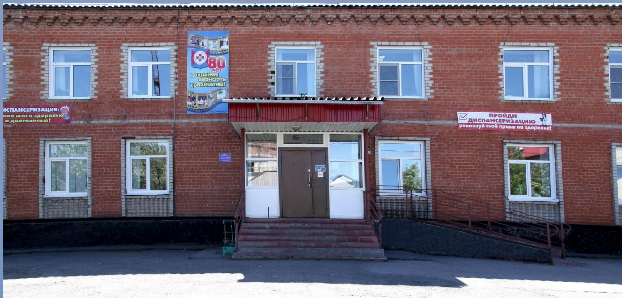
Взрослая и детская поликлиники