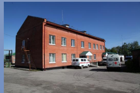
Станция скорой медицинской помощи

На удаленных территориях работают 3 врачебные амбулатории, 4 общеврачебные практики, 32 фельдшерско-акушерских пункта, 2 дома сестринского ухода. В районе работает 110 врачей, 318 фельдшеров и медсестер.