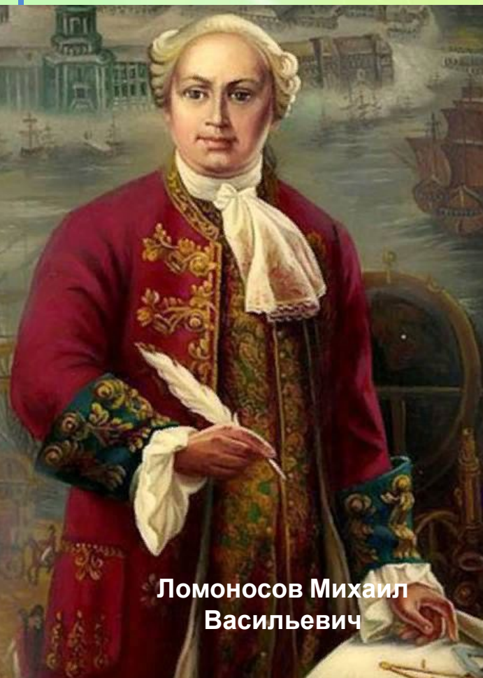
Ломоносов Михаил Васильевич

Вошел в науку как астроном, приборостроитель, географ и металлург, геолог, поэт, филолог, художник, историк и генеалог, поборник развития отечественного просвещения, науки и экономики.