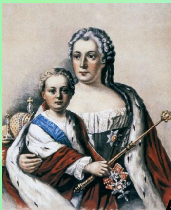
Иван VI (Иоанн Антонович)