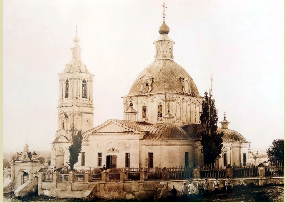
Так выглядела когда-то Троицкая церковь в Качалино.

В станице Качалинской Иловлинского района Волгоградской области стоит одинокая колокольня. Строение это относится к XVIII веку и относится к периоду процветания Области Войска Донского, к которой и принадлежала станица. До Дона отсюда всего два километра. В те времена, когда железные дороги ещё отсутствовали, здесь проходила знаменитая Переволока - торговый путь между пристанями Волги и Дона, начинавшийся у Дубовки и заканчивавшийся здесь. В 1840-е годы сюда была проведена Дубовско-Качалинская железная дорога, одна из первых железных дорог России.