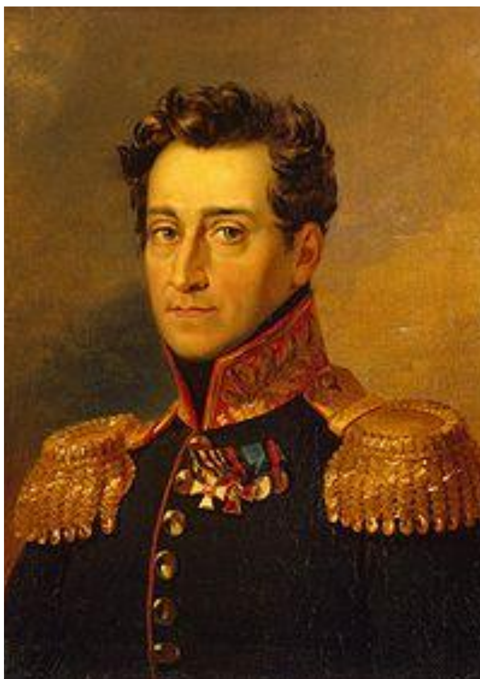
И. В. Гудович

В конце июня на правый берег Дуная переправились главные силы генерала Репнина (ок. 30 тысяч человек) и 28 июня (9 июля) нанесли поражение при Мачине 80-тысячной турецкой армии.