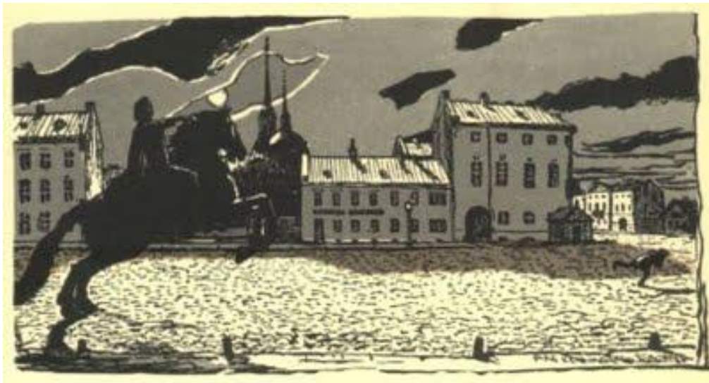
А.Н.БЕНУА. ИЛЛЮСТРАЦИЯ К «МЕДНОМУ ВСАДНИКУ». 1903.