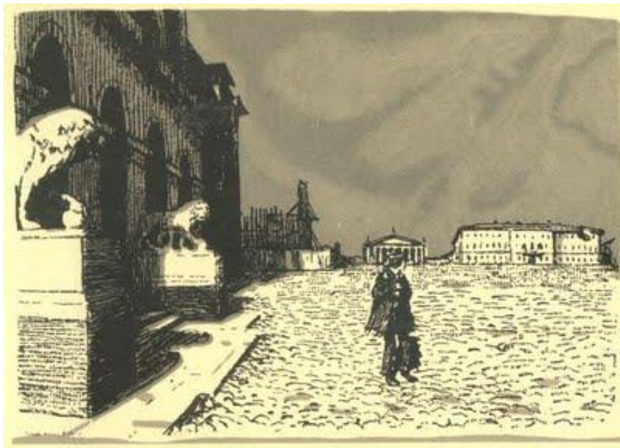
А.Н.Бенуа. Иллюстрация к «Медному всаднику». 1903.