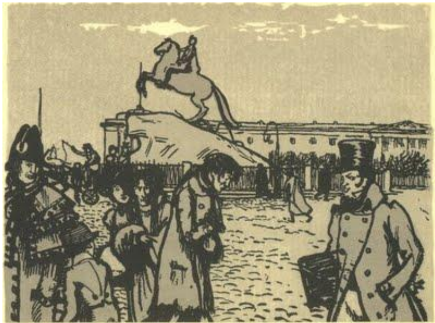
А.Н.Бенуа. Иллюстрация к «Медному всаднику». 1903.

И С ТОЙ ПОРЫ, КОГДА СЛУЧАЛОСЬ ИДТИ ТОЙ ПЛОЩАДЬЮ ЕМУ В ЕГО ЛИЦЕ ИЗОБРАЖАЛОСЬ СМЯТЕНЬЕ. К СЕРДЦУ СВОЕМУ ОН ПРИЖИМАЛ ПОСТЕШНО РУКУ КАК БЫ ЕГО СМИРЯ МУКУ КАРТУЗ ИЗНОШЕННЫЙ СЫМАЛ, СМУЩЕННЫХ ГЛАЗ НЕ ПОДЫМАЛ И ШЕЛ СТОРОНКОЙ.