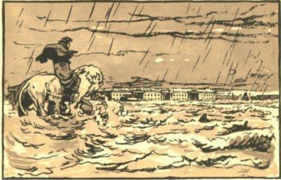
А.Н.Бенуа. Иллюстрация к «Медному всаднику». 1916.