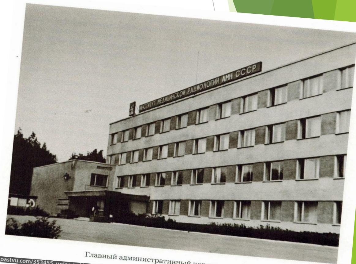
Главный административный корпус института

25 октября 1966 года издан приказ Минздрава СССР и решение Президиума АМН СССР об учреждении Медицинского училища при НИИМР АМН СССР.