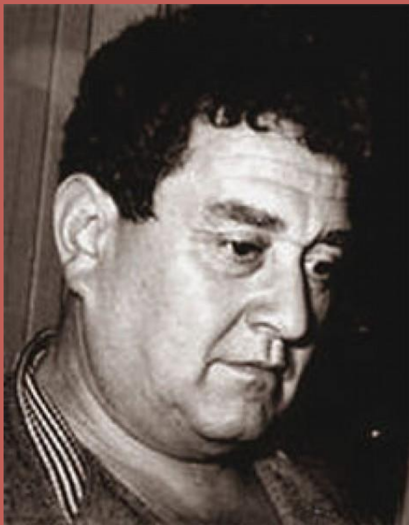
Драгунский Виктор Юзефович