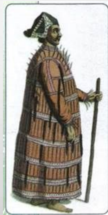
Алеут. Рисунок XIX в.