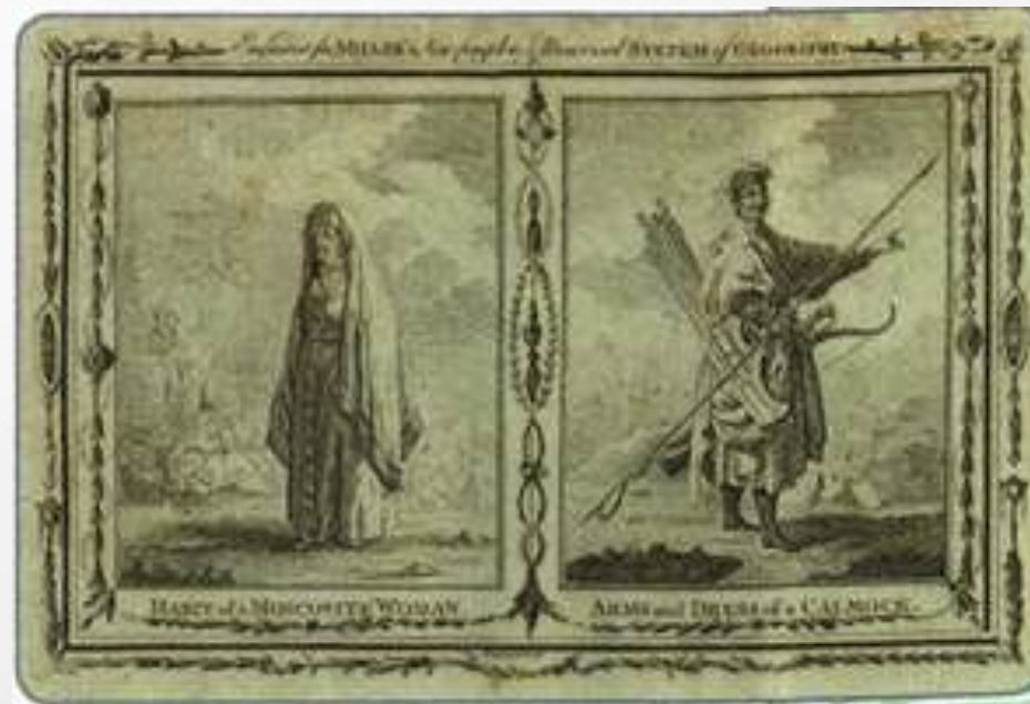
Калмыки. Литография XIX в.