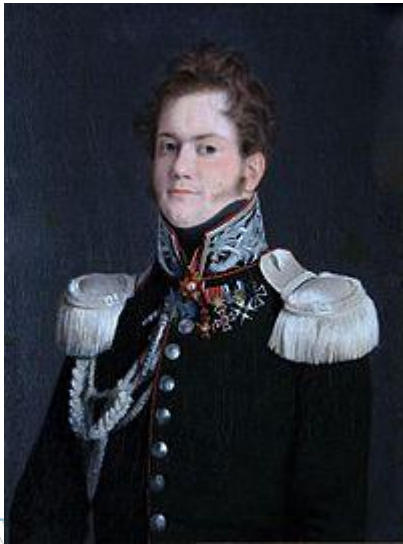
Александр Николаевич Муравьев