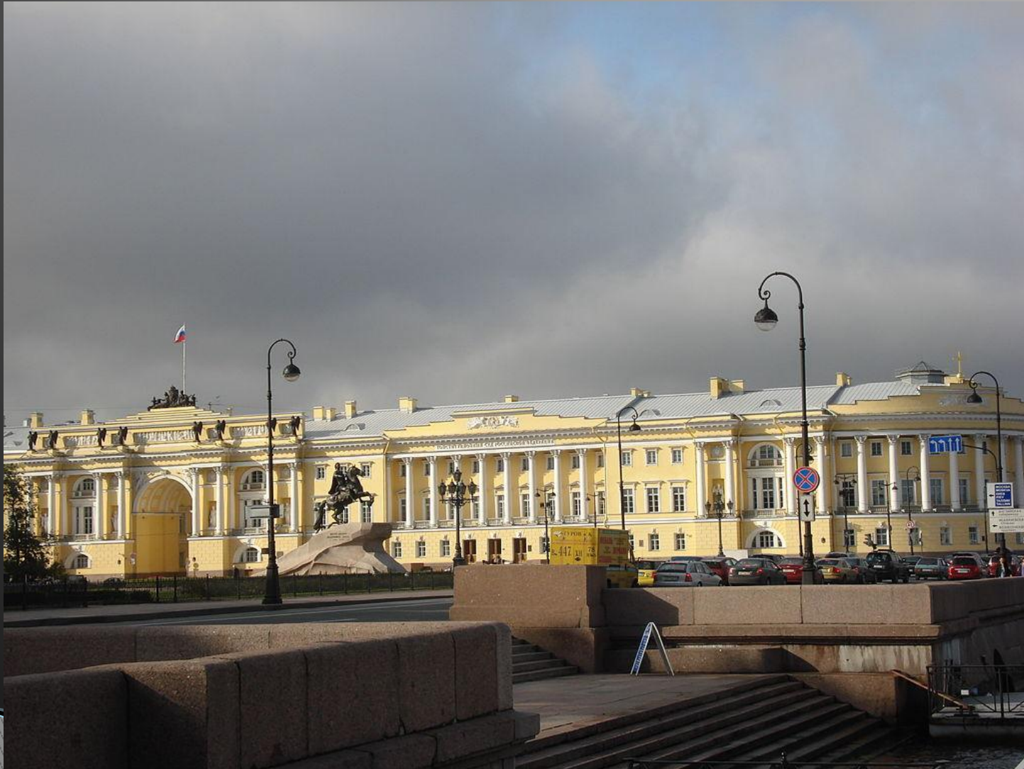
Здание Сената и Синода в Петербурге