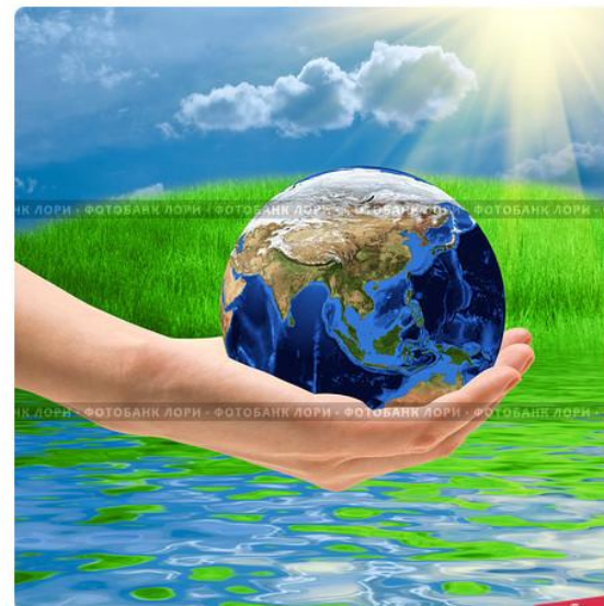
Земной шар в женских руках. Забота об окружающем мире

Смотрю на глобус – шар земной, И вдруг вздохнул он как живой. И шепчут мне материки: «Ты береги нас, береги!»