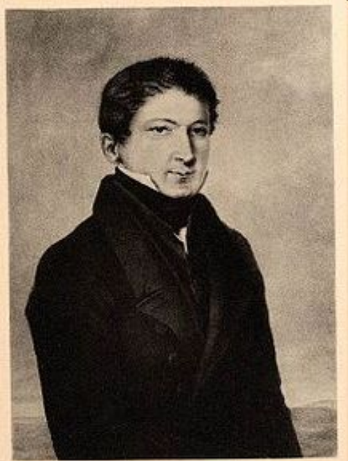
М.И. Муравьев- Апостол

2) «Мы были дети 1812 г.» М.И.Муравьев-Апостол