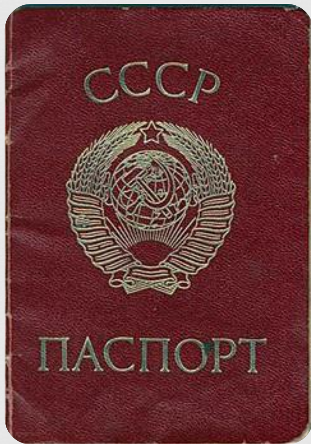
Паспорт громадянина СРСР, зразка 1974 року