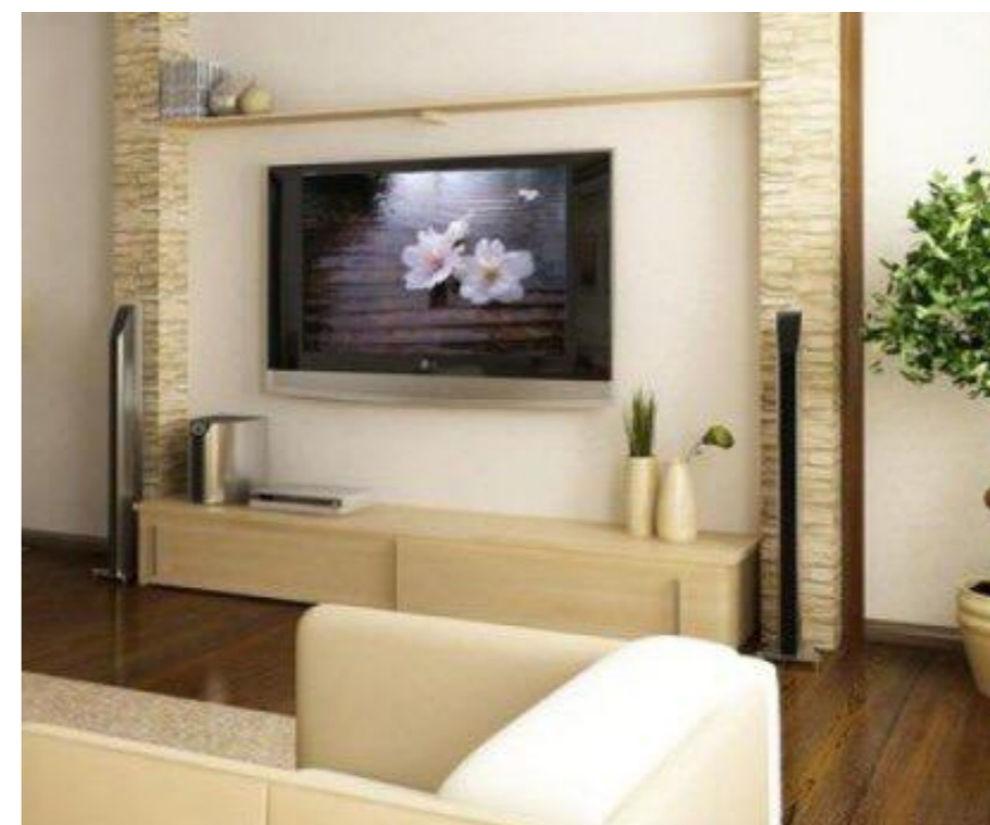
Деревья Бонсай в интерьере фитодизайна