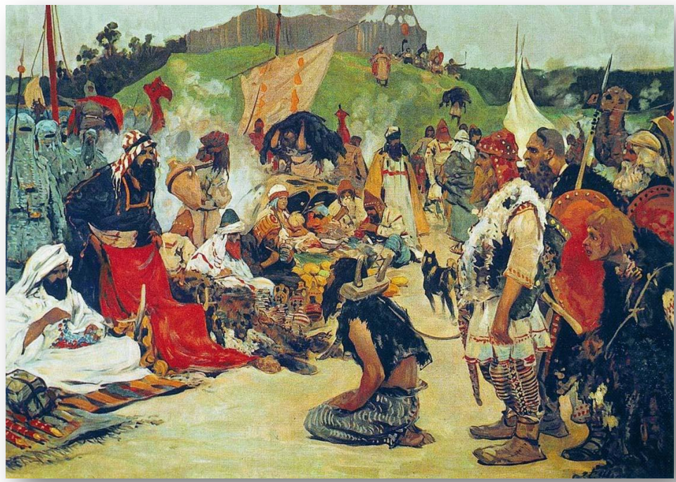
«Торг в стране восточных славян» - Сергей Иванов

- социологическая теория, согласно которой закономерности естественного отбора и борьбы за существование, выявленные Чарльзом Дарвином в природе, распространяются в том числе и на отношения в человеческом обществе.