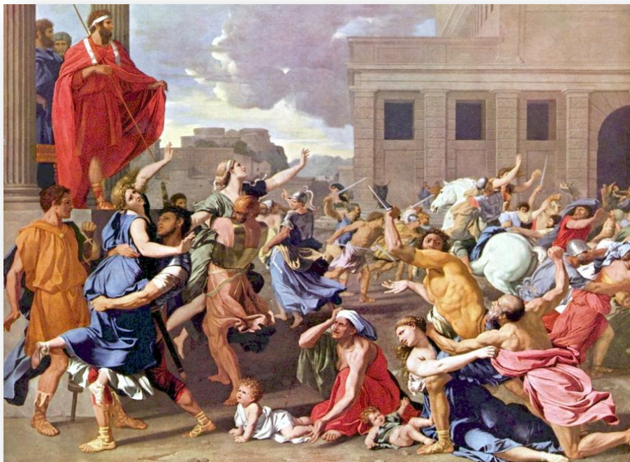
Похищение сабинянок (художник Николя Пуссен, 1636 г.)