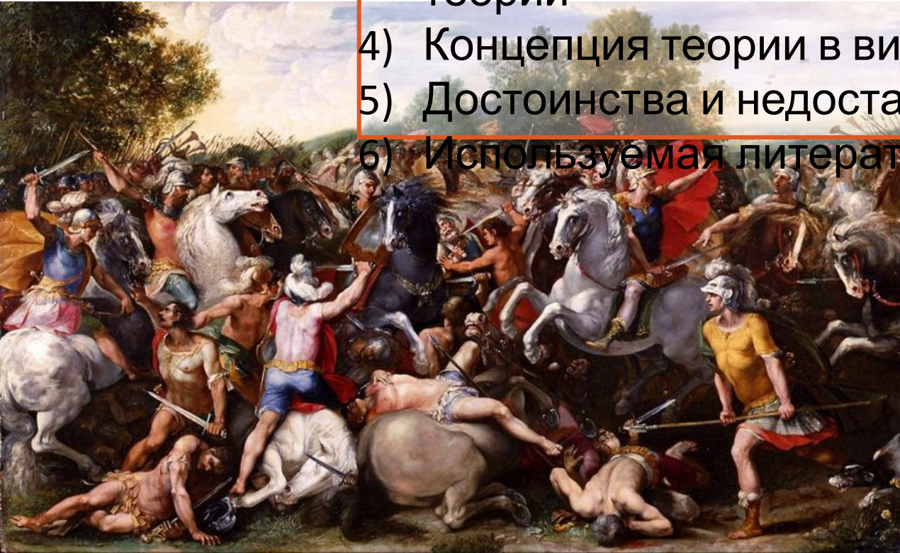
Победа Тулла Гостилия над Вейями и Фиденами (художник Джузеппе Чезари, 1595 г.)