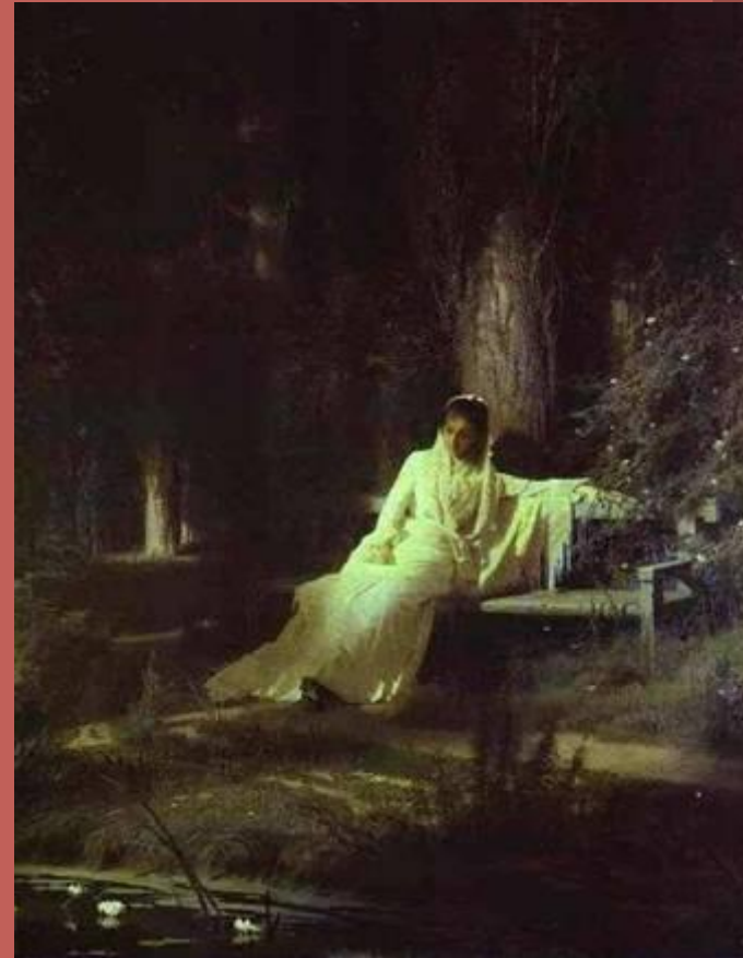
«Лунная ночь» Крамской И.Н.