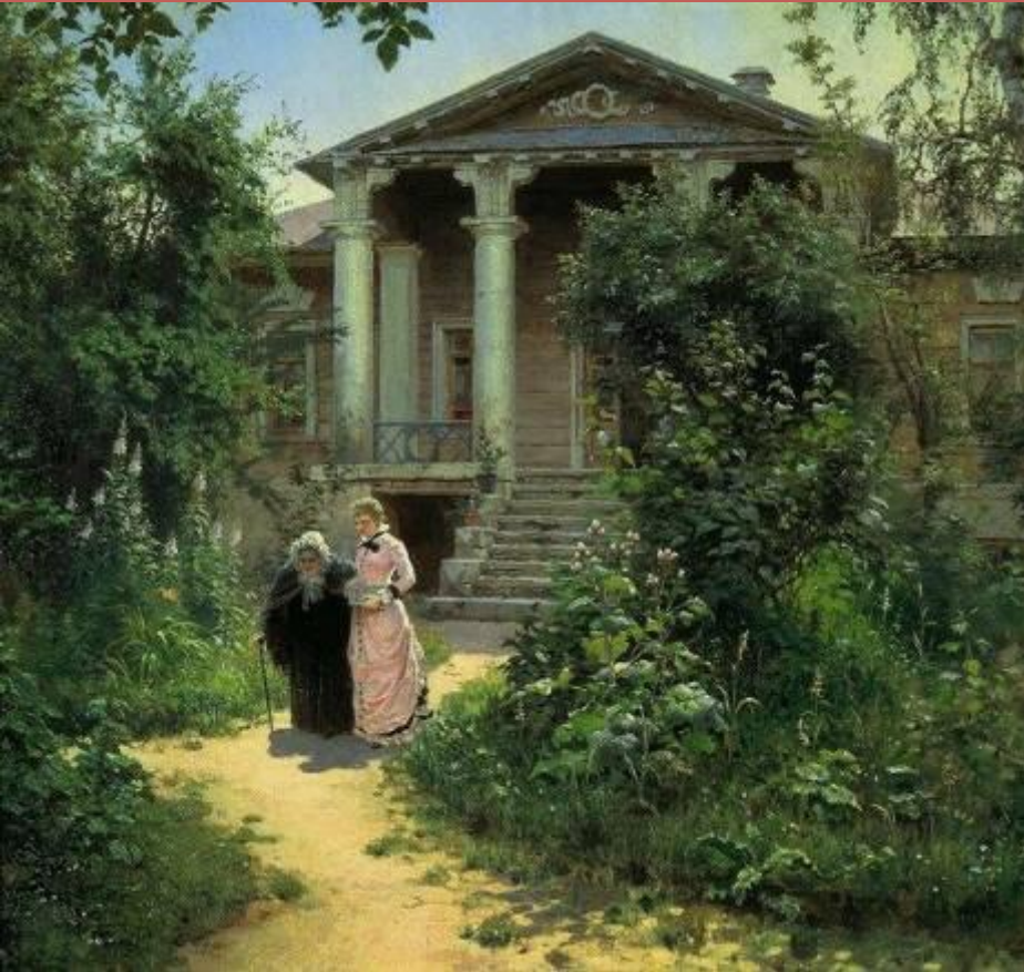
«Бабушкин сад» Поленов В.Д.