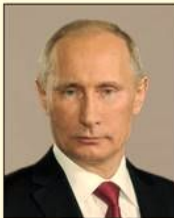
В. В. Путин 2000–2008