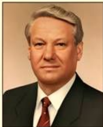
Б. Н. Ельцин 1991–1999