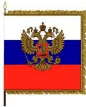
Штандарт (флаг) Президента Российской Федерации