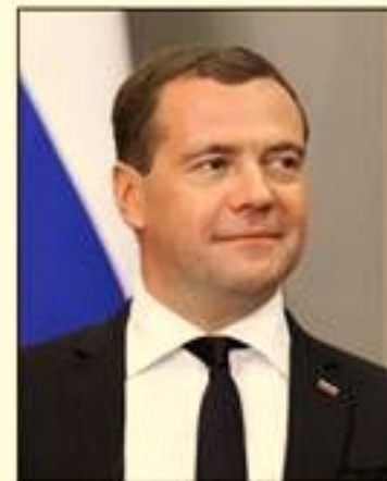
Д. А. Медведев 2008–2012

В 2012 году президентом Российской Федерации был вновь избран Владимир Владимирович Путин.