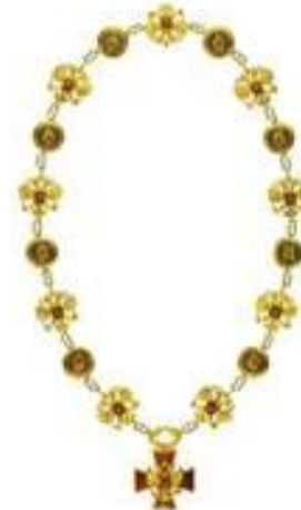
Знак Президента Российской Федерации